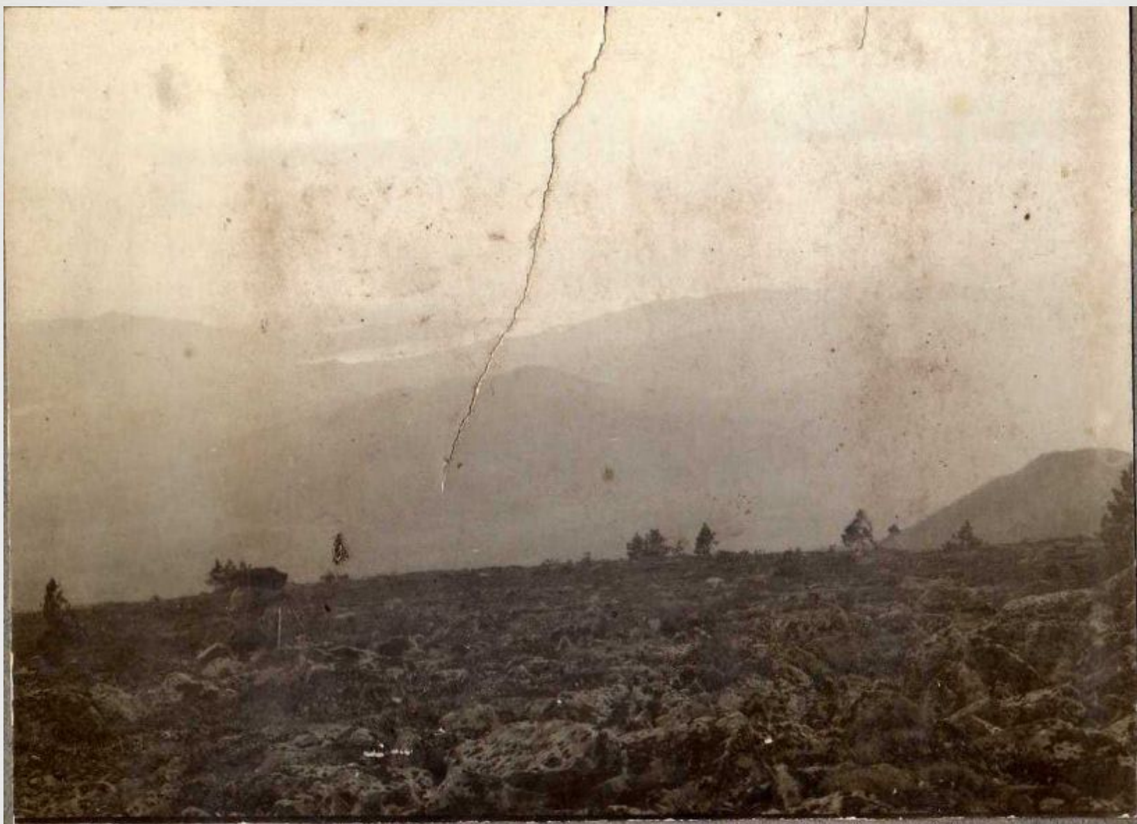
2. Вид с хр. Кози на оз. Тибэркулъ.