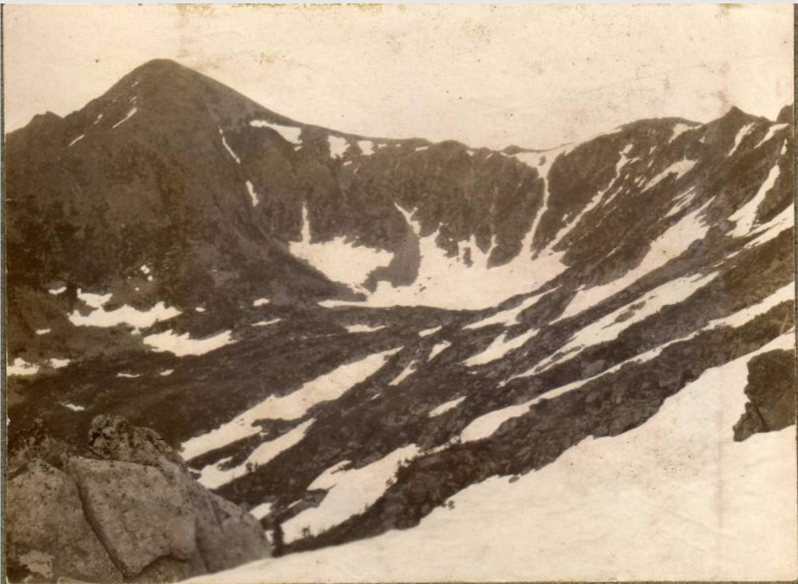
4. Истоки р. Зайки. Хр. Козя.