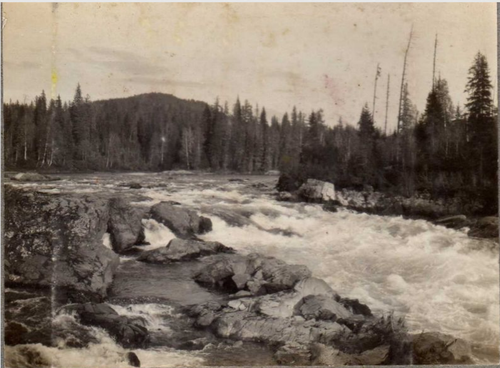
17. Кизир. 1-й порог.