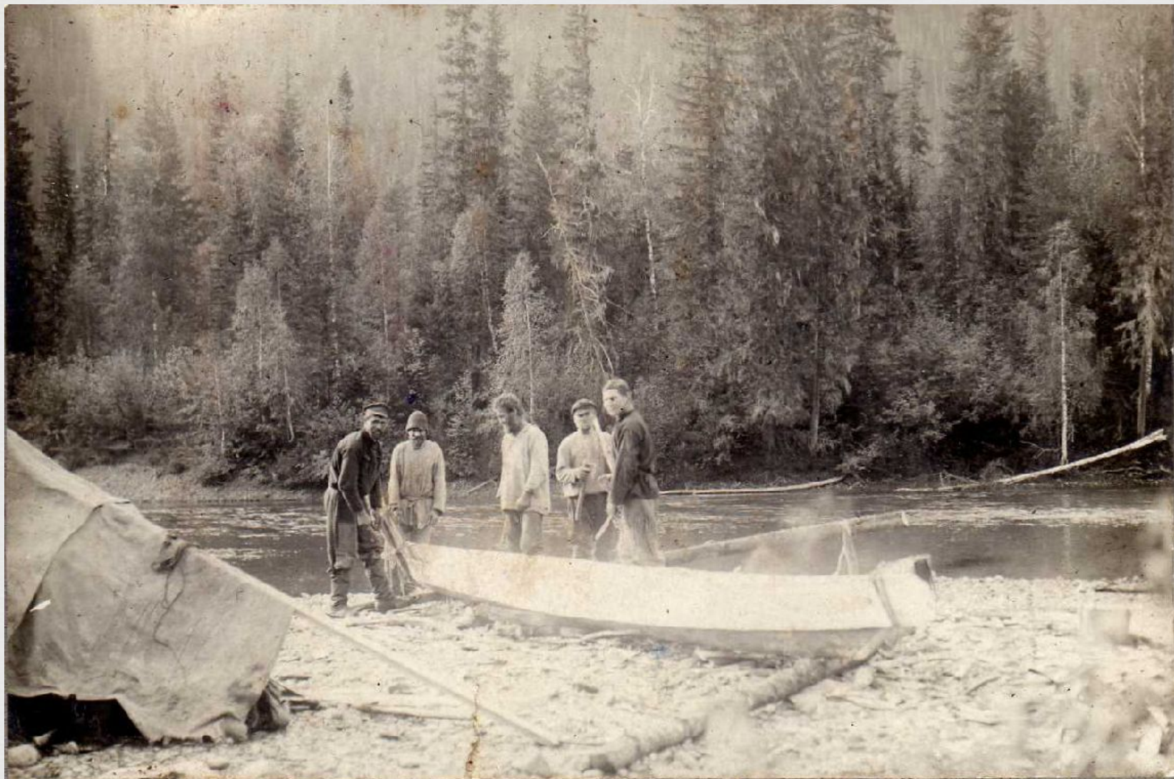
9. Постройка лодки.