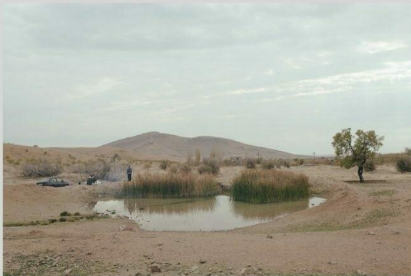
Solmaz Daryani, 2015