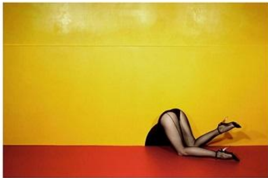
Ги Бурден, 1979 год