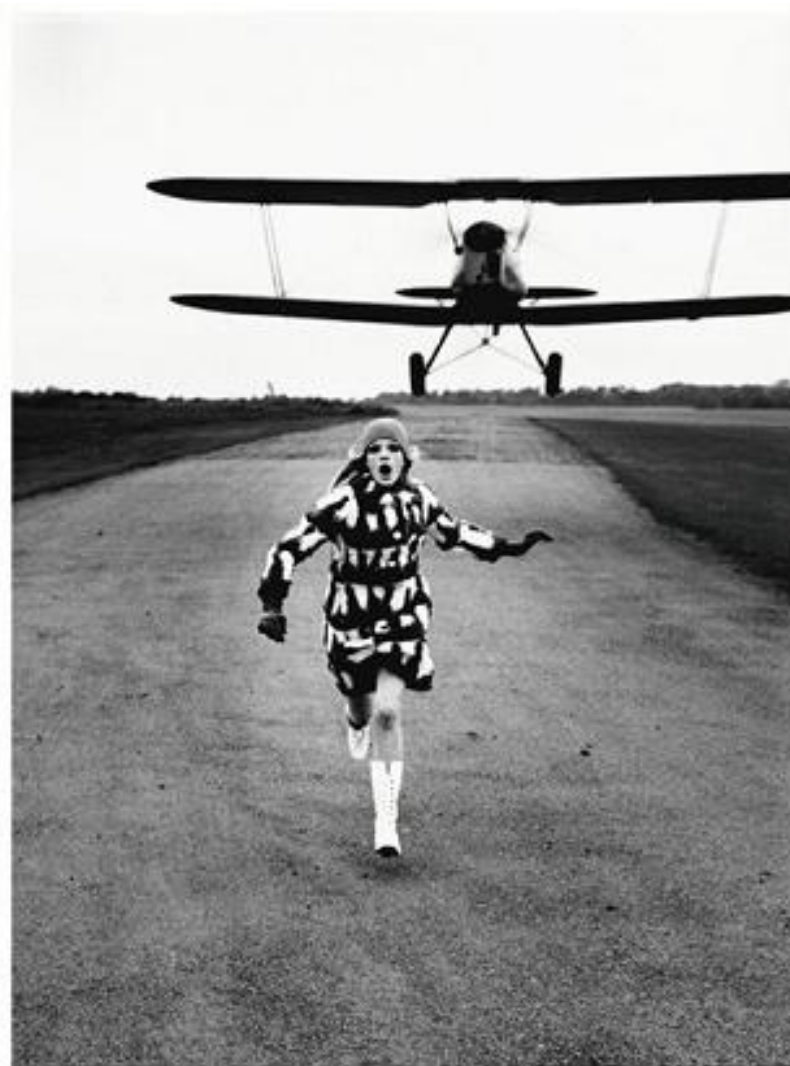
Хельмут Ньютон, 1967 год