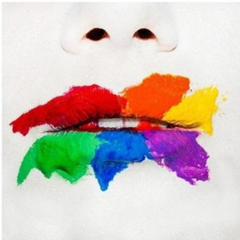
Тайлер Шилдс, 2010 год