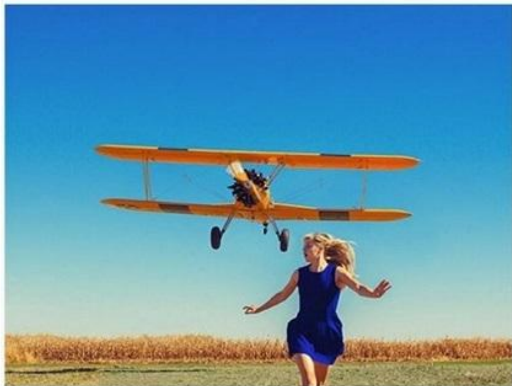
Тайлер Шилдс, 2015 год