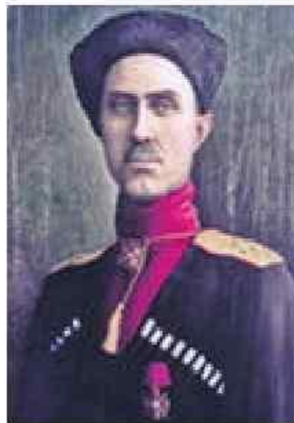
Врангель Петр Николаевич