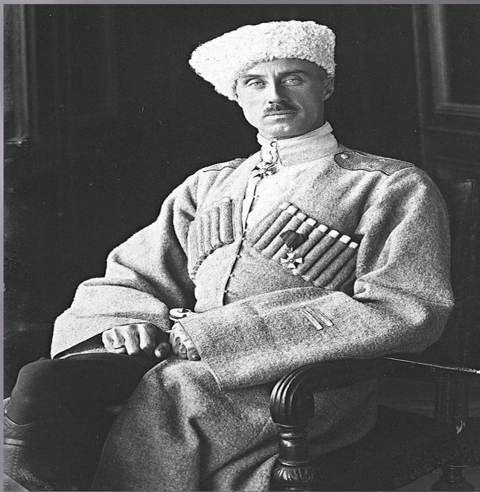
Врангель Петр Николаевич 27 августа 1878 г-25 апреля 1928 г.