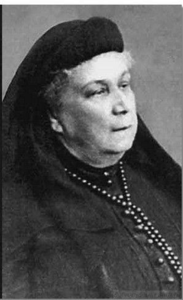
Мария Дмитриевна Врангель