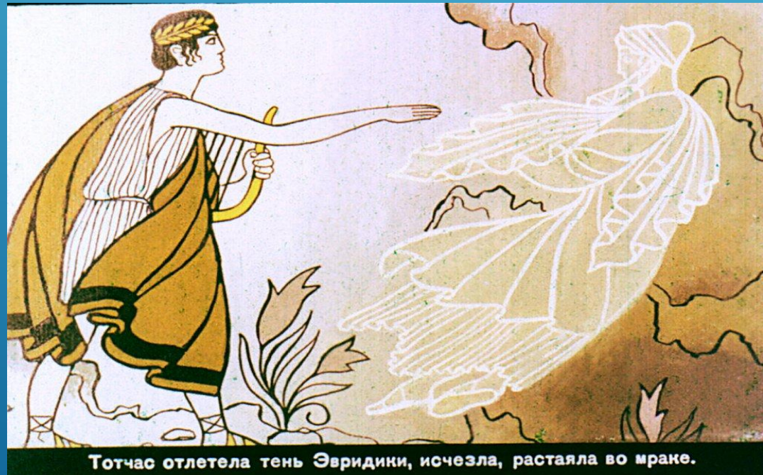
Тотчас отлетела тень Эвридики, исчезла, растаяла во мраке.