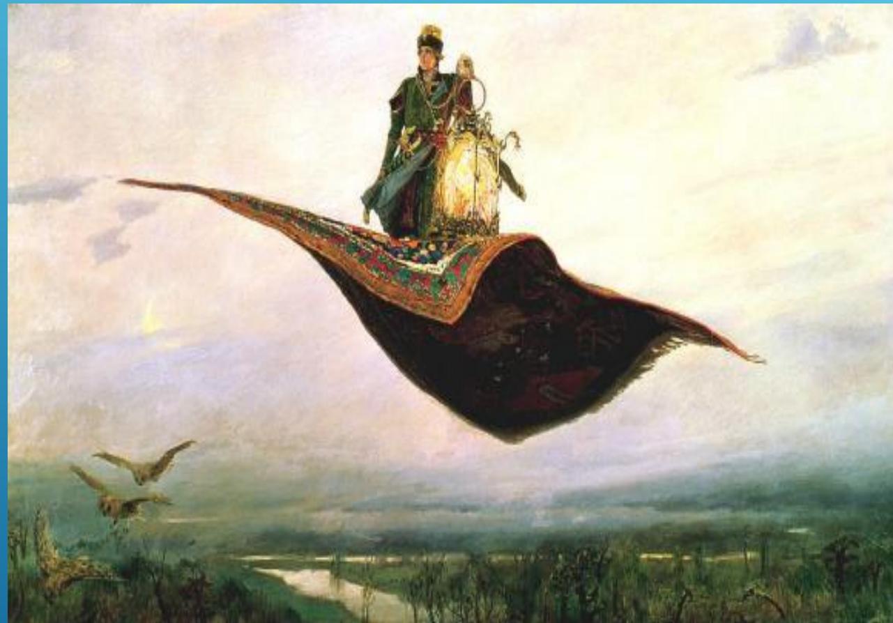
Виктор Васнецов «Ковер - самолет»