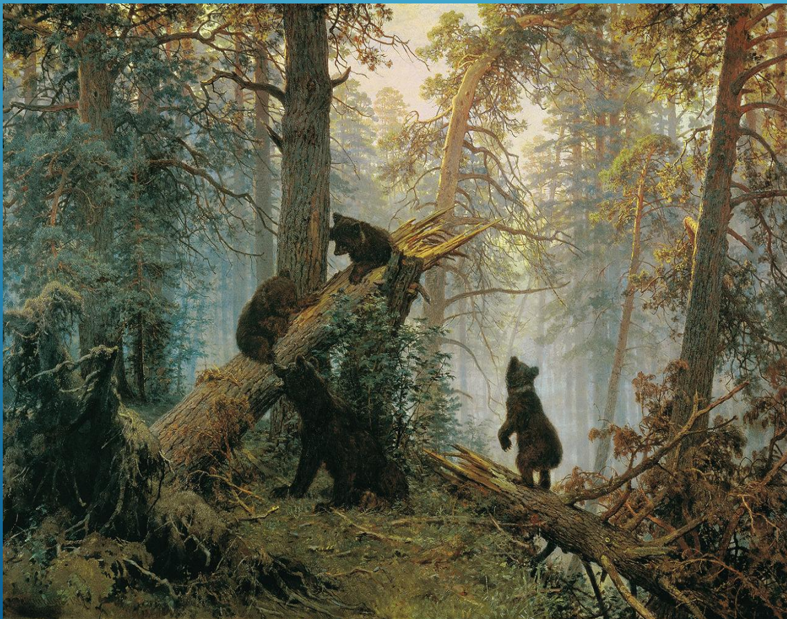
«Утро в сосновом лесу» Иван Шишкин