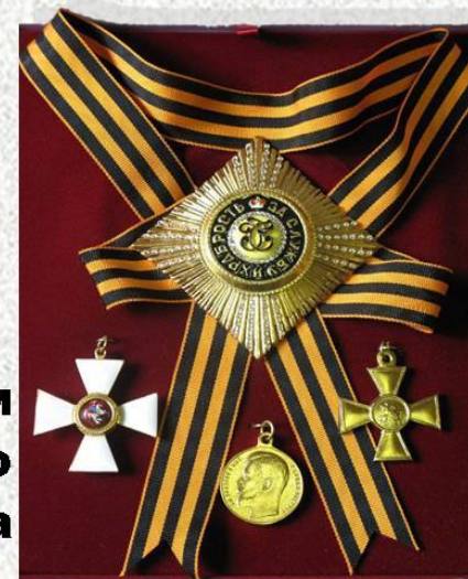
Звезда и знаки к ордену св.Георгия