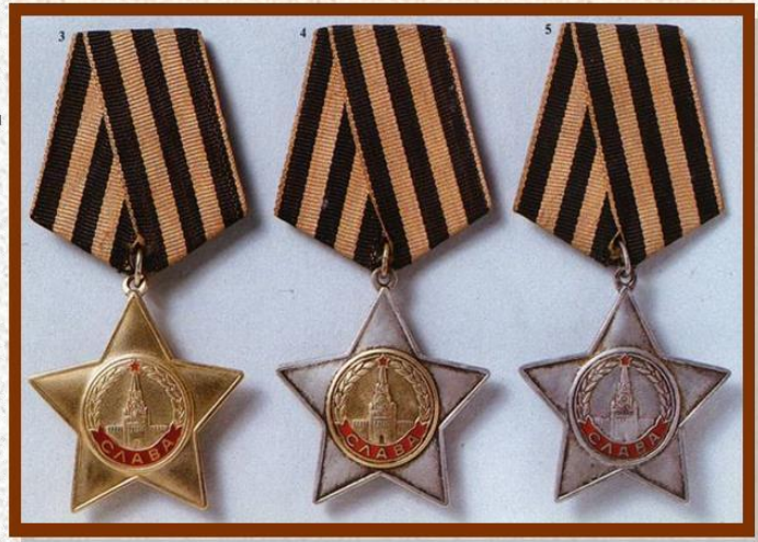
Три степени ордена Славы

Награждение орденом Славы продолжалось с ноября 1943 до лета 1945 года. За этот период кавалерами III степени ордена стали 980 тысяч человек, II степени - 46 тысяч, а I степени, то есть полными кавалерами ордена - 2 562 человека. В 1967 и 1975 годах были введены дополнительные льготы полным кавалерам ордена Славы, уравнявшие их в правах с Героями Советского Союза.