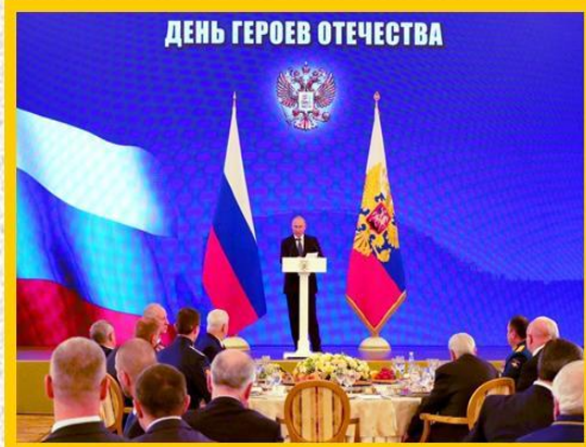
Празднование в современной России