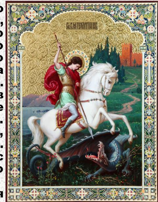
Икона св. Георгия Победоносца

8 августа 2000 г. орден Святого Георгия был восстановлен в качестве высшей военной награды России, а в 2007 г. был возрождён и праздник - День Героев Отечества, который впервые отмечался в России 9 декабря 2007 г.