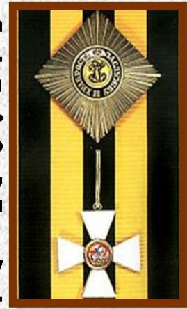
Орден св.Георгия I ст.