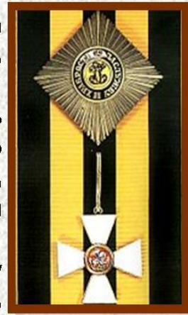
Орден св.Георгия I ст.