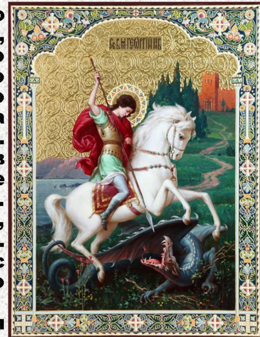
Икона св. Георгия Победоносца

8 августа 2000 г. орден Святого Георгия был восстановлен в качестве высшей военной награды России, а в 2007 г. был возрождён и праздник - День Героев Отечества, который впервые отмечался в России 9 декабря 2007 г.