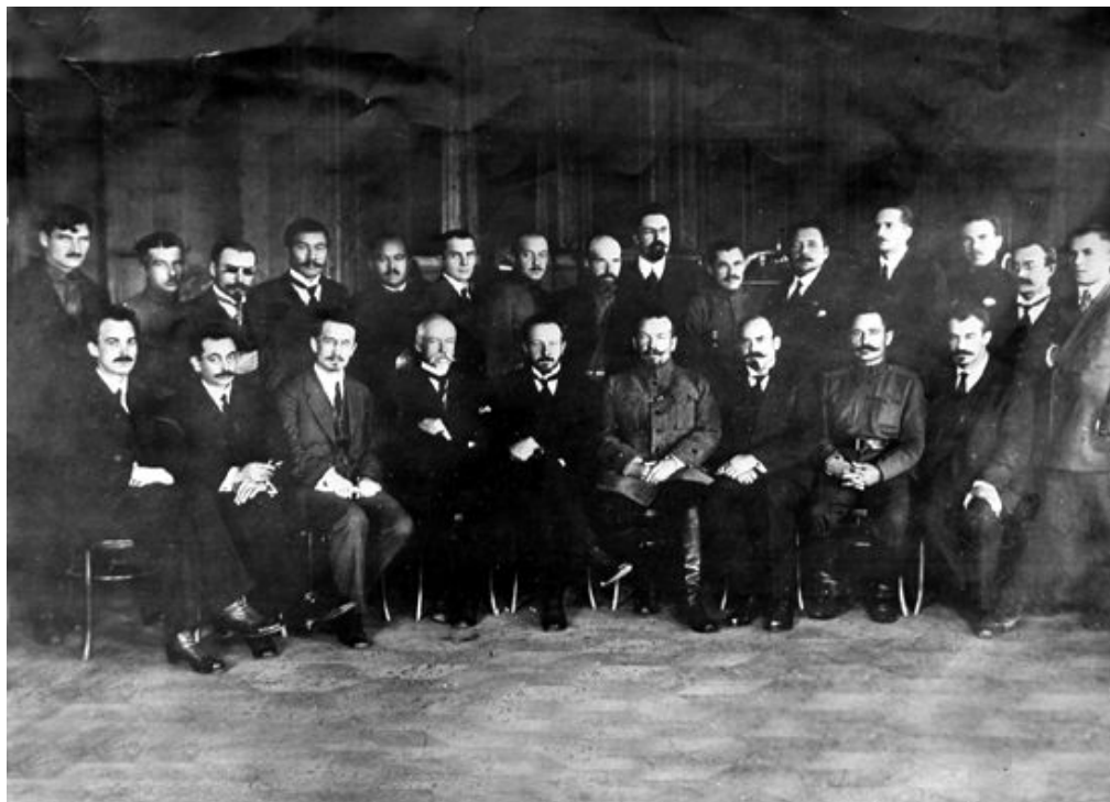
А. Букейханов. Жизнь после смерти.