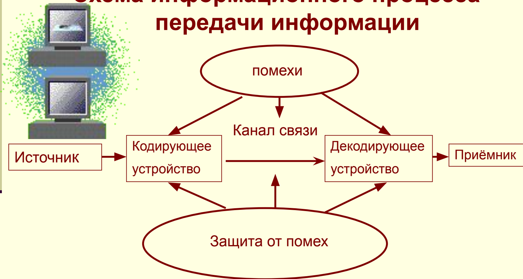
Схема информационного процесса передачи информации

Передача информации необходима для распространения её в пространстве.