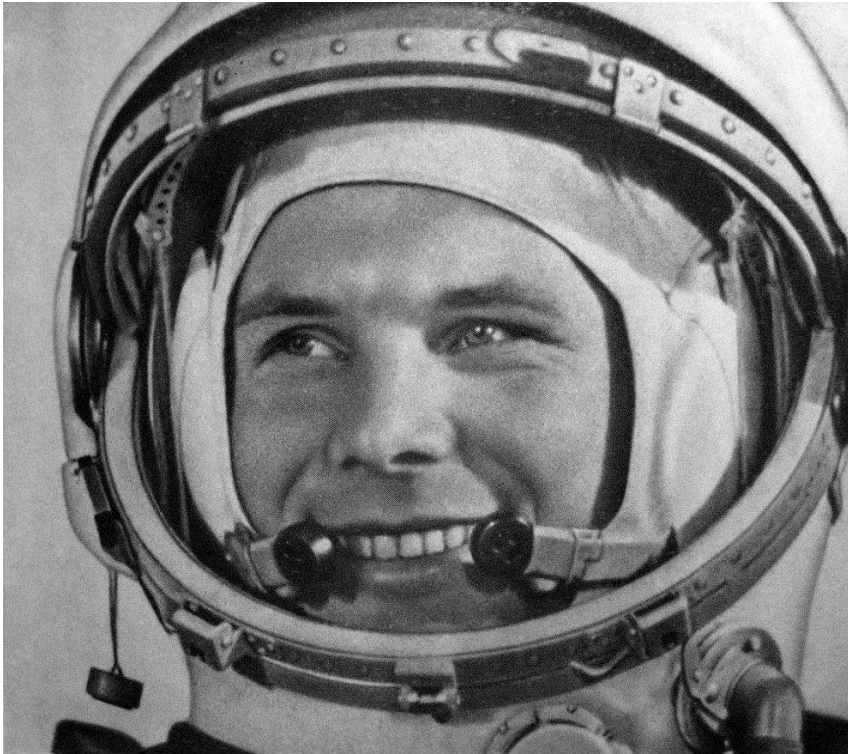
Герман Степанович Титов