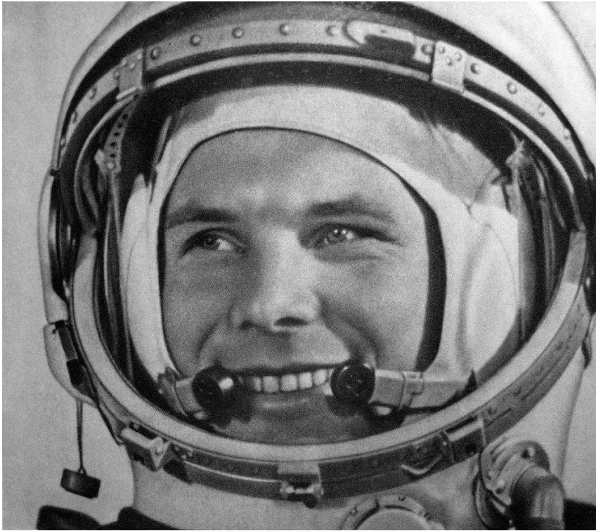
Герман Степанович Титов