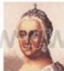
Екатерина II 1762-1796 гг. "просвещенный абсолютизм" 1762-1773 гг.

(в 30.07.1767 г. - в Москве; с февр. 1768 г. - в Санкт-Петербурге)