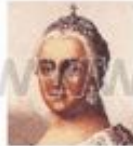
Екатерина II 1762-1796 гг. "просвещенный абсолютизм" 1762-1773 гг.

Систематизация законодательства России со времени Соборного уложения 1649г. (Алексея Михайловича) (в 30.07.1767 г. - в Москве; с февр. 1768 г. - в Санкт-Петербурге)