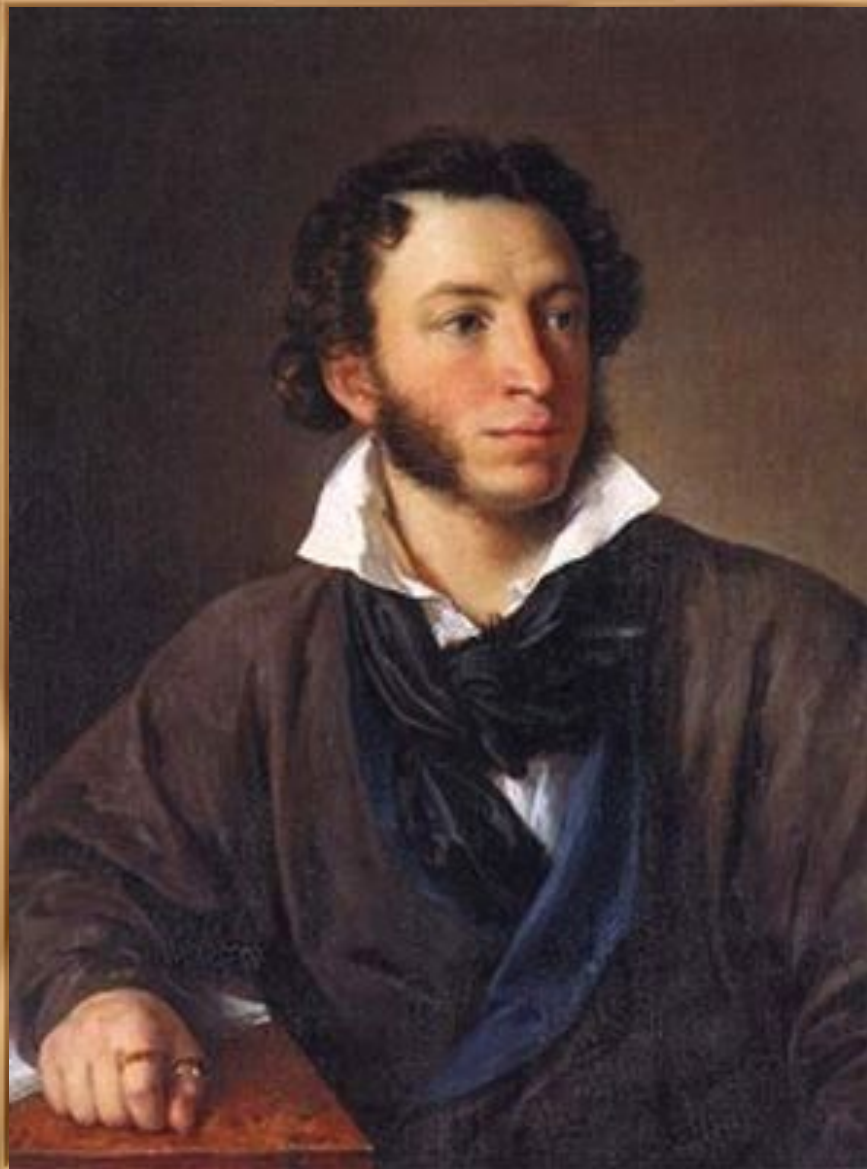
В. А. Тропинин. "Портрет Пушкина". 1827 г. Холст, масло.