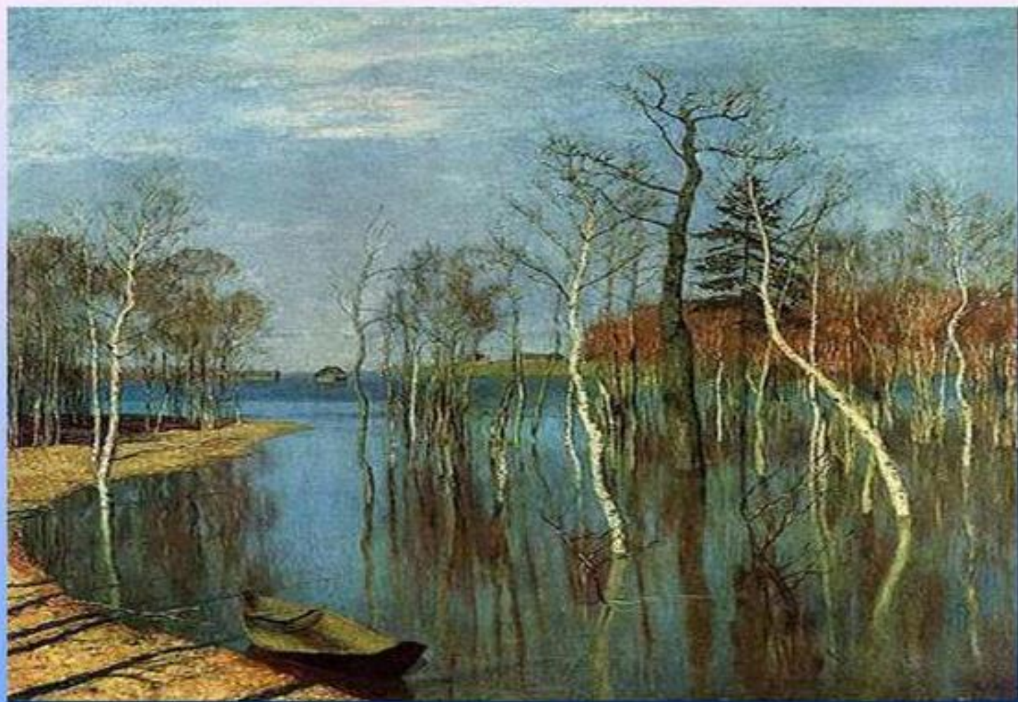
И. Левитан. «Весна. Большая вода»