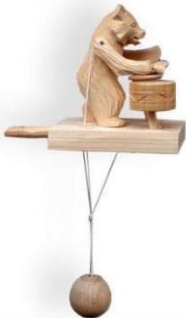
Игрушка с движением