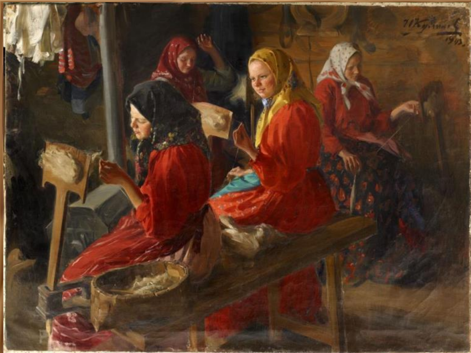
И.С. Куликов. «Пряхи».