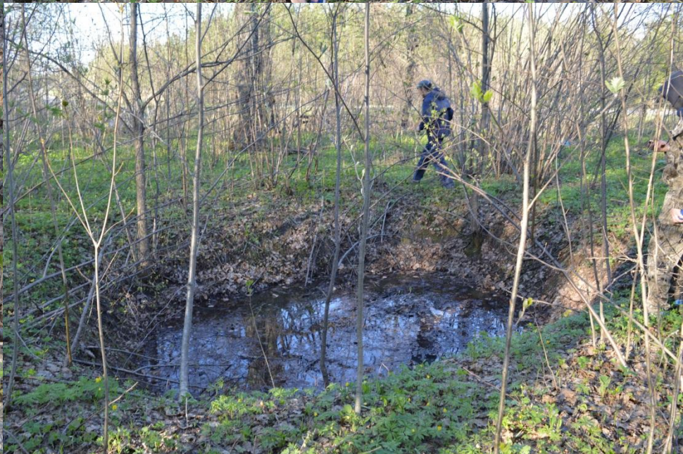
Дзоты в лесу на маршруте между с.Шоркистры и озером Аль