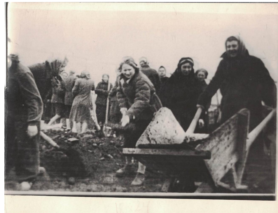
Участие студентов в строительстве ГРЭС-2