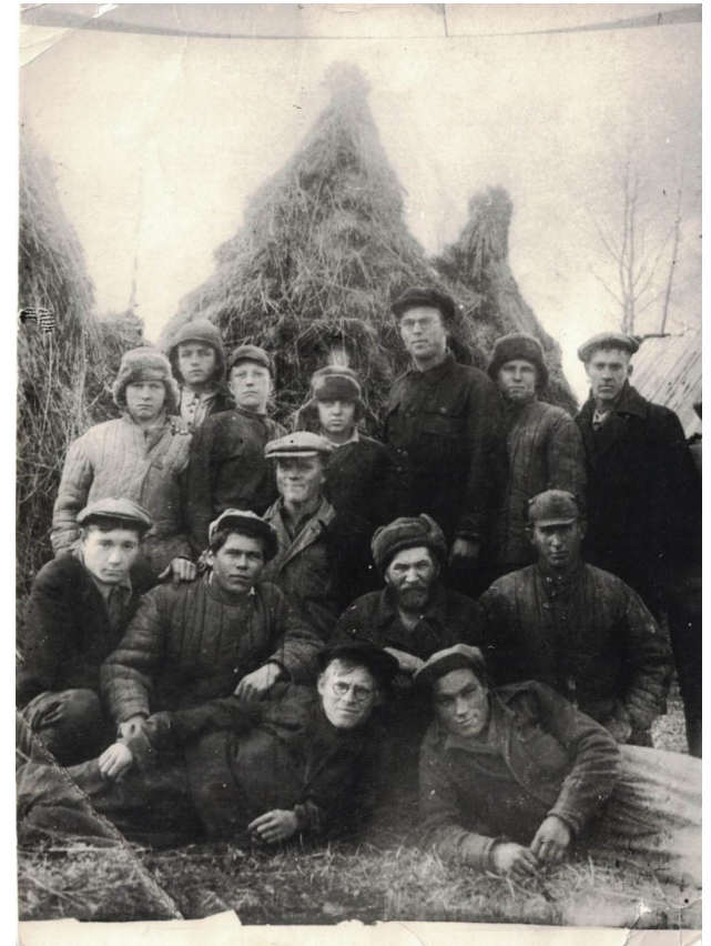
Студенты на сельхоз работах