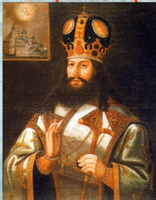
Патриарх Никон (1605-1681)