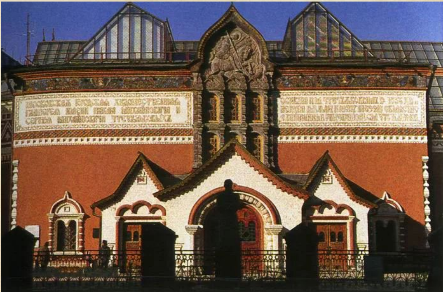
Фасад московской Третьяковской галереи, выполненный по эскизам В. Васнецова