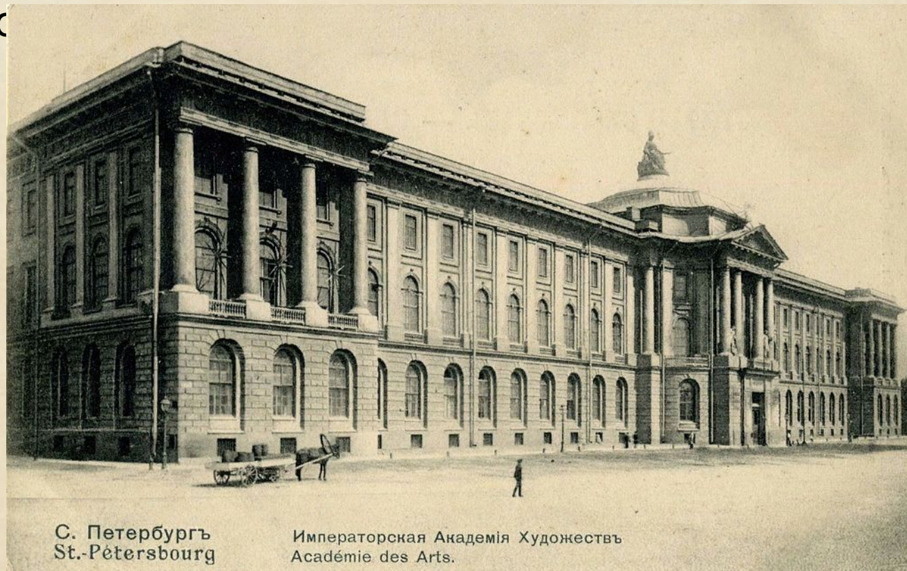
С. Петербургъ St.-Petersbourg

Семинарию Васнецов не закончил, уйдя с последнего курса. С благословения отца отправился в Петербург поступать в Академию художеств. Учился живописи в Петербурге — сперва у И. Н. Крамского в Рисовальной школе общества поощрения художников (1867—1868), затем — в Академии художеств (1868—1875). Получал серебряные медали ИАХ: две малые (1869) и б