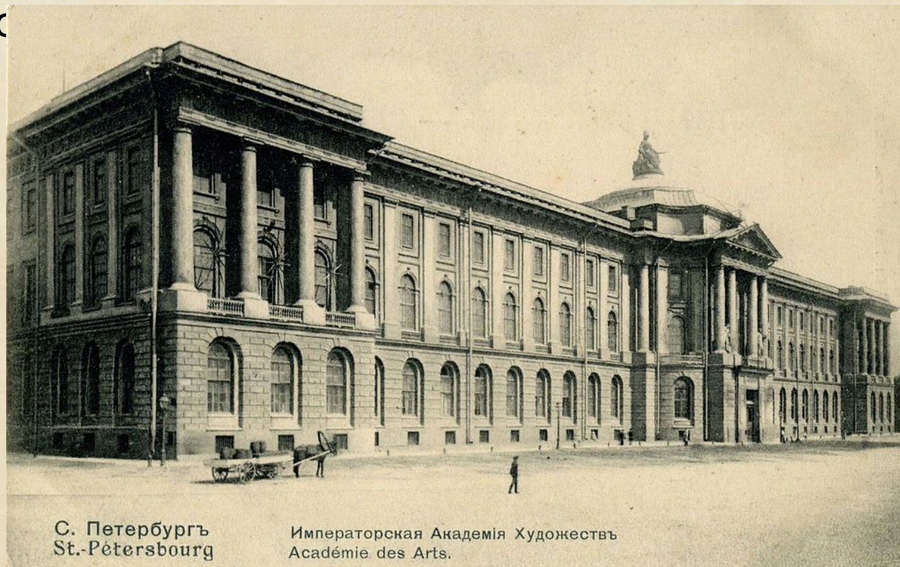
С. Петербургъ St.-Petersbourg

Семинарию Васнецов не закончил, уйдя с последнего курса. С благословения отца отправился в Петербург поступать в Академию художеств. Учился живописи в Петербурге — сперва у И. Н. Крамского в Рисовальной школе общества поощрения художников (1867—1868), затем — в Академии художеств (1868—1875). Получал серебряные медали ИАХ: две малые (1869) и б