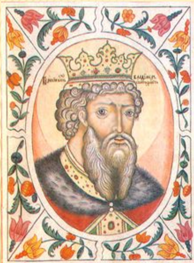
□ Князь Владимир

Создавались учебные заведения после Крещения Руси. Первая школа была открыта в Киеве в 988 году.