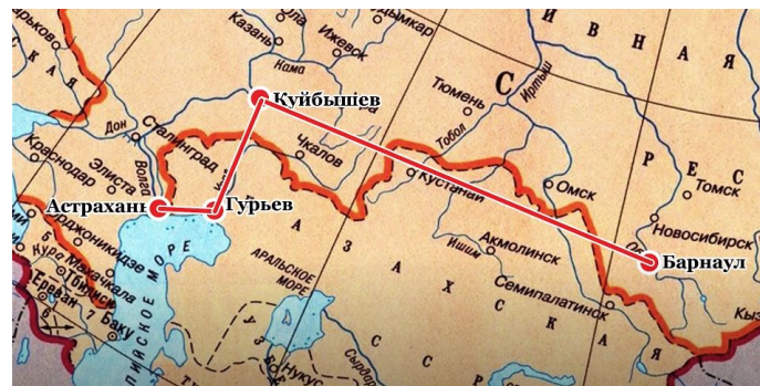
Образное, наглядное осмысление фактов