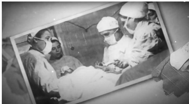
Предъявление информации в звукозрительной форме