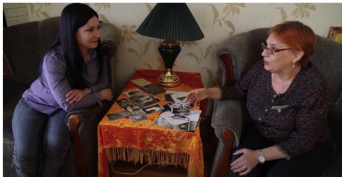
Соединение рационального и эмоционального зрительского восприятия