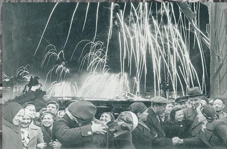
«ВЕЛИКАЯ ПОБЕДА ОДЕРЖАНА СОВЕТСКИМИ ВОЙСКАМИ ПОД ЛЕНИНГРАДОМ:»