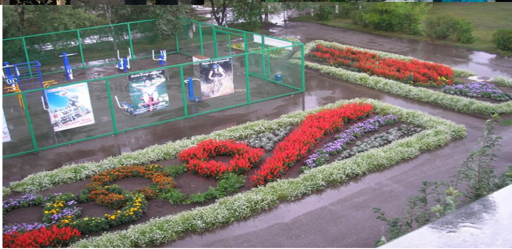
Школьный двор летом