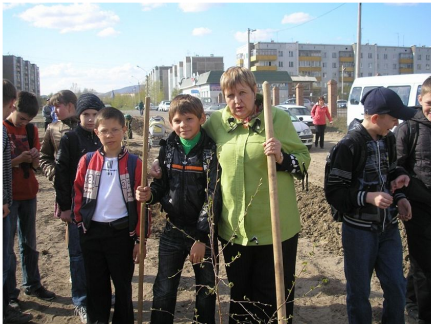
Закладка берёзовой аллеи возле школы №16