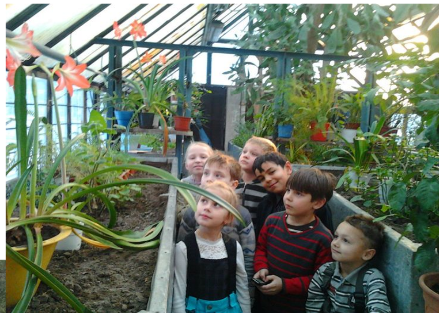
В школьной теплице