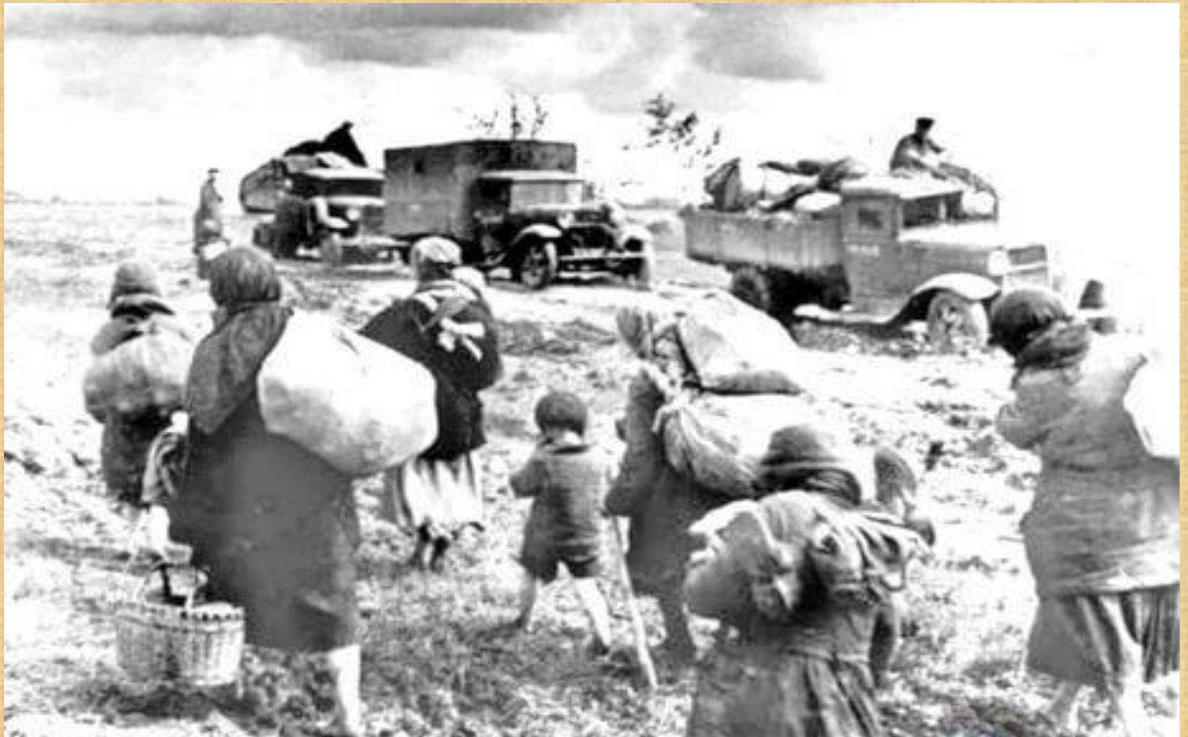
Эвакуация людей из разгромленного немцами города