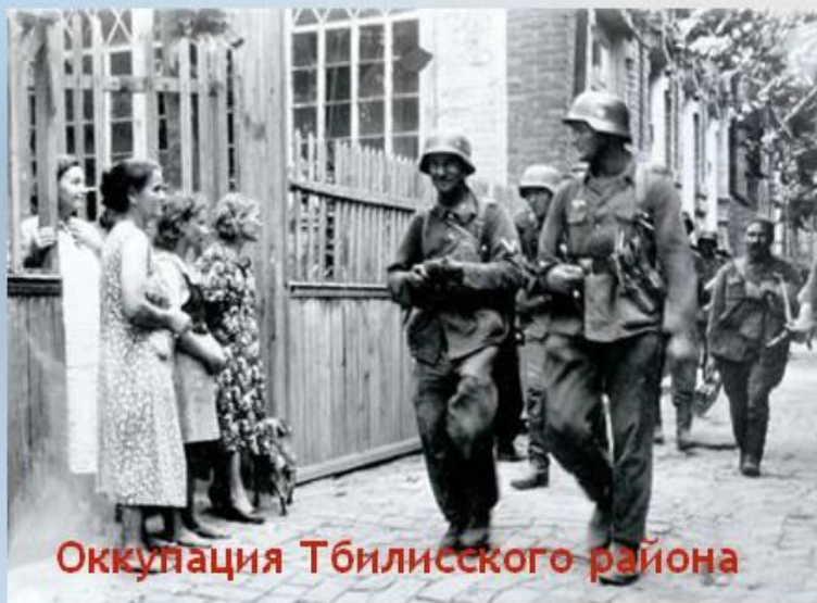
Оккупация Тбилисского района

1941 - 1945 годы - Великая Отечественная война