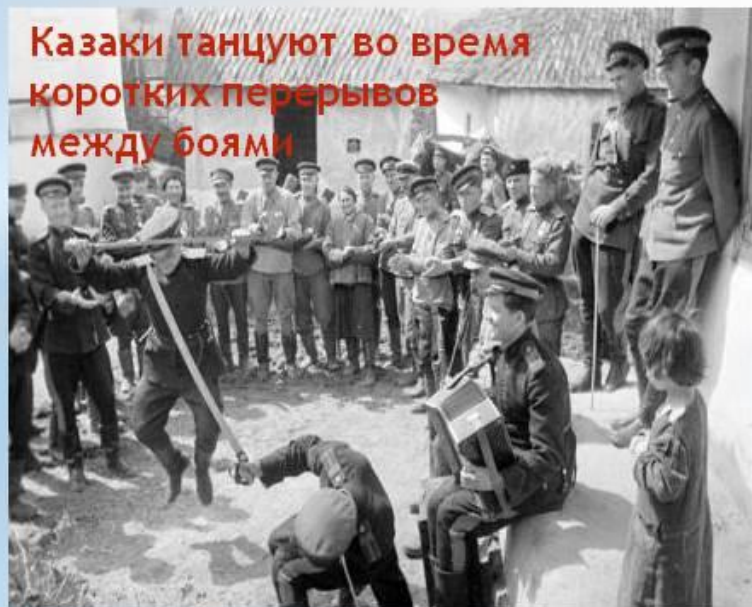
Казачи танцуют во время коротких перерывов между боями

В 1942 - 1943 годах Кубань была оккупирована (захвачена) фашистской Германией