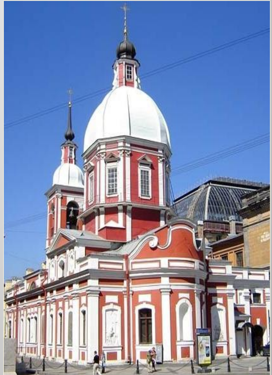
Церковь Св. Пантелеймона