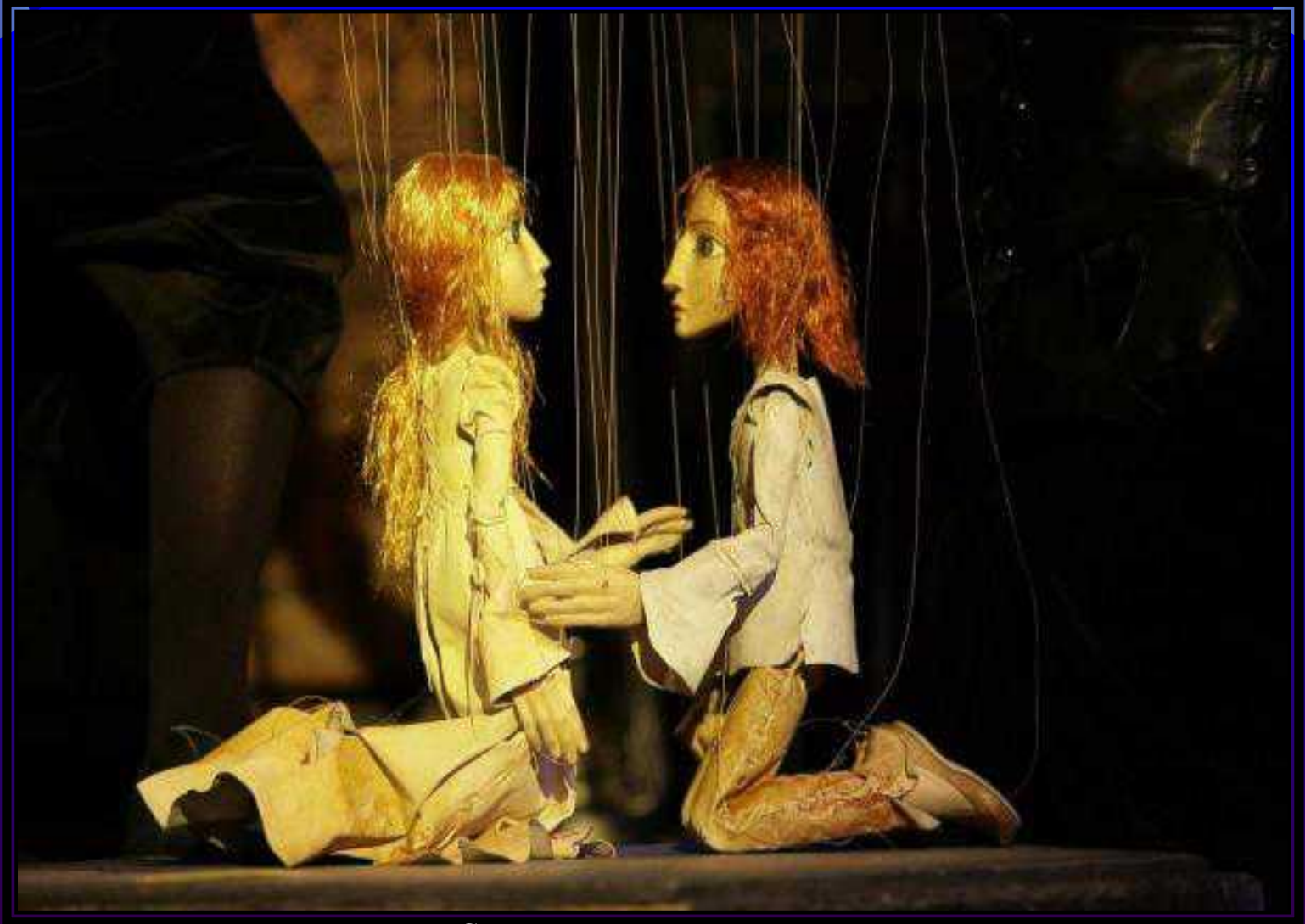
Спектакль для подростков: Ромео и Джульетта