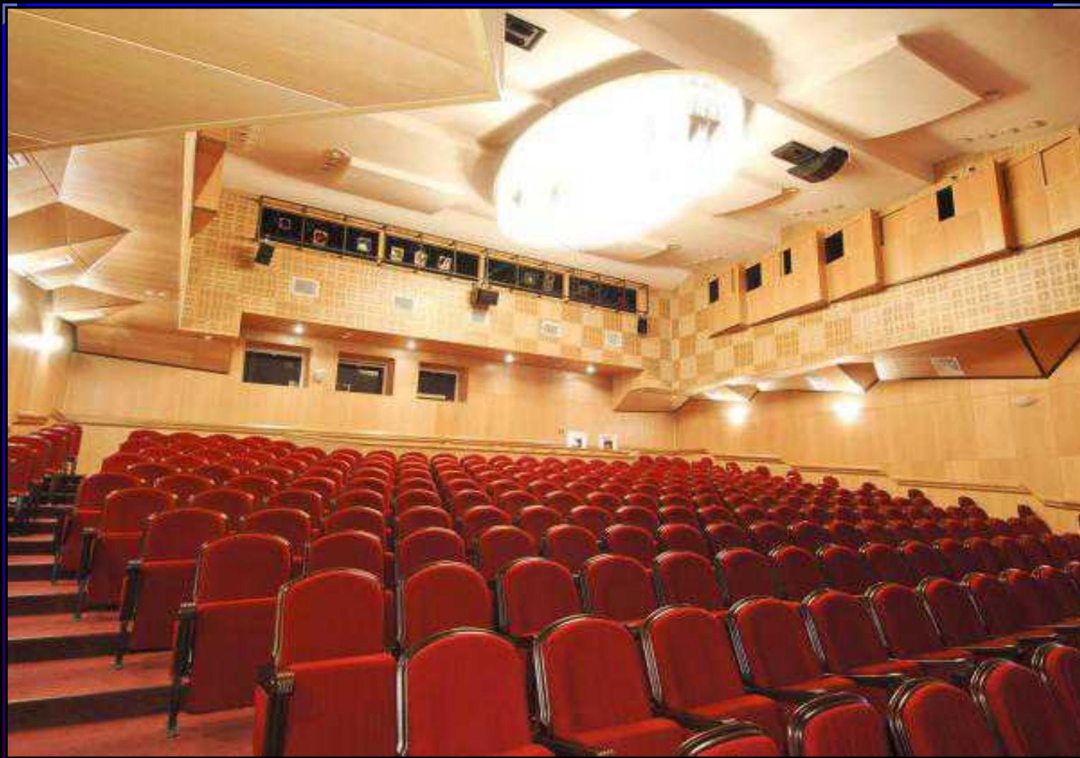
Так выглядит большой зал