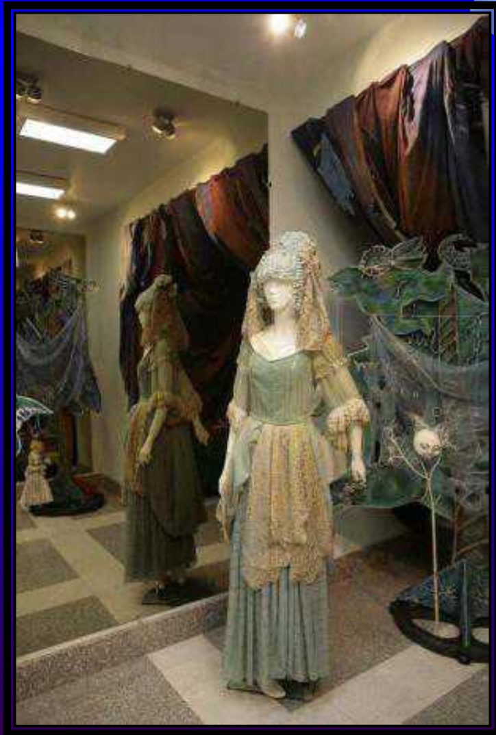
Экспозиция «В гостях у сказки»