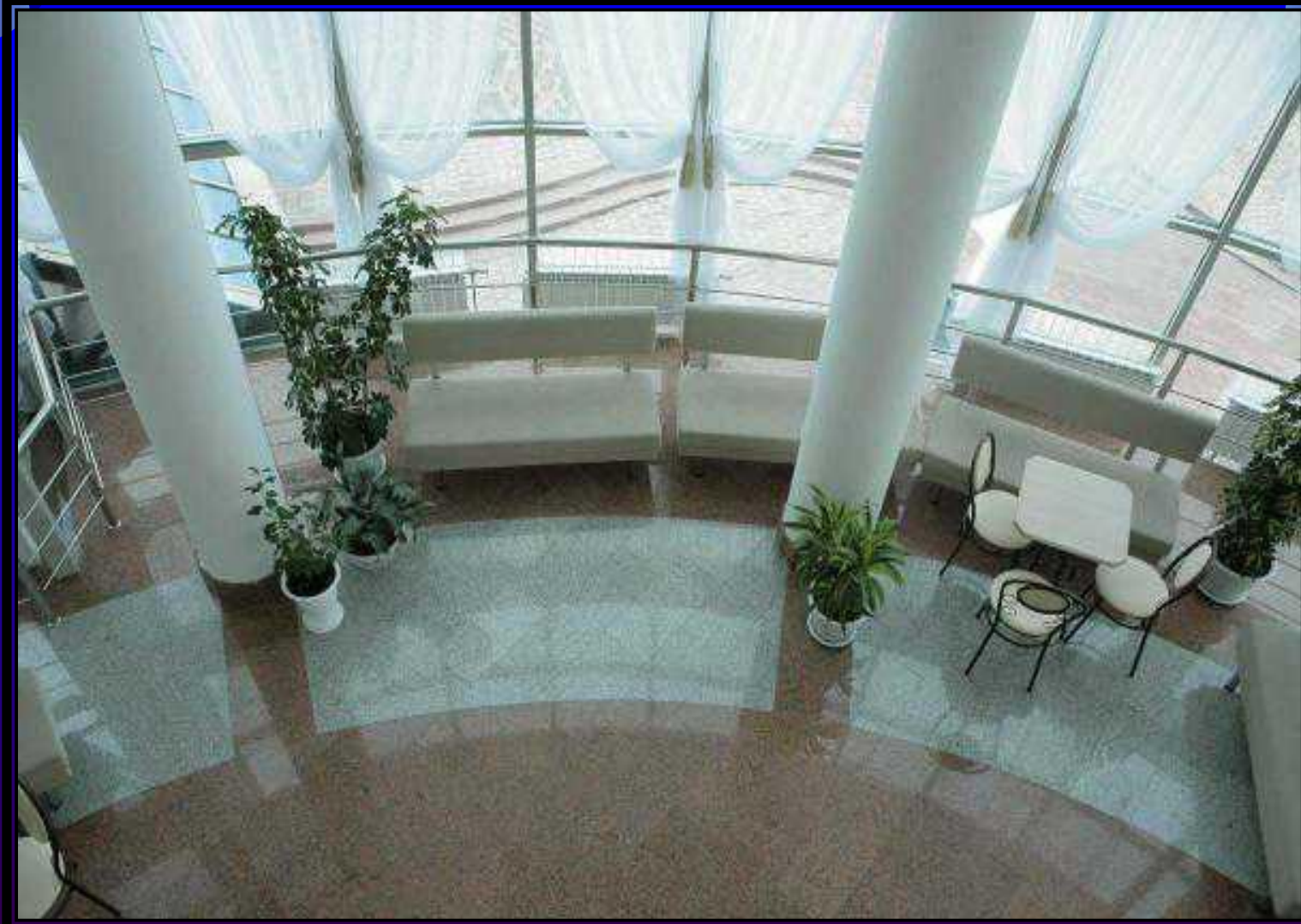
Фойе – гостиная собирает зрителей Малого зала.