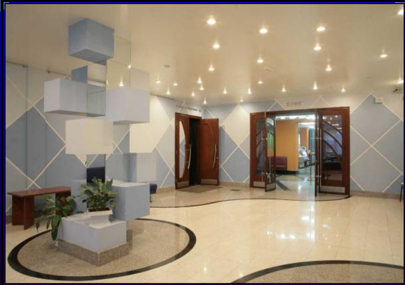
Фойе – гостиная собирает зрителей Малого зала