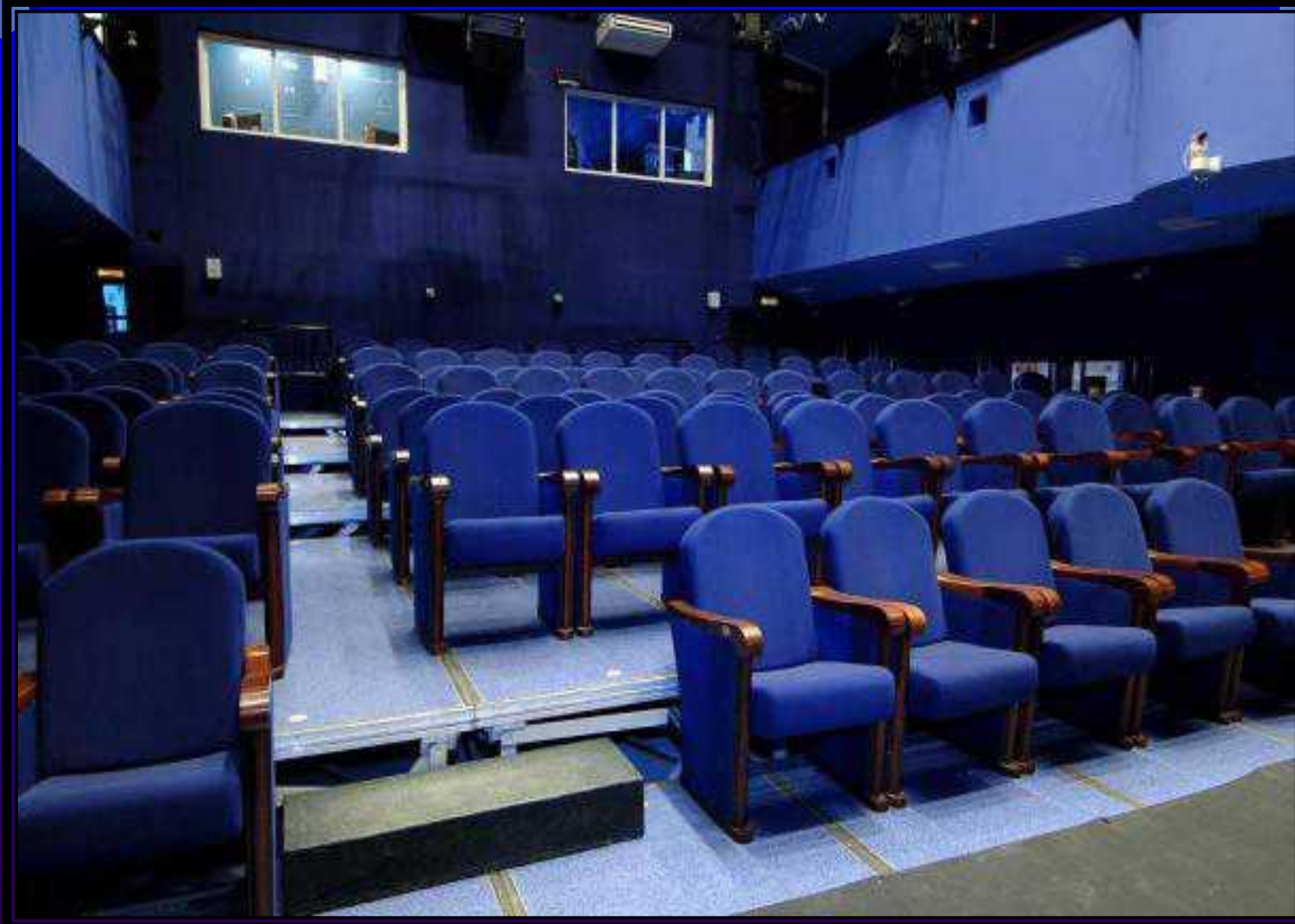
Так выглядит малый зал