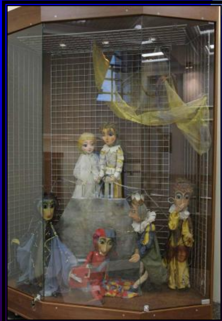
Экспозиция спектакля «Золушка»