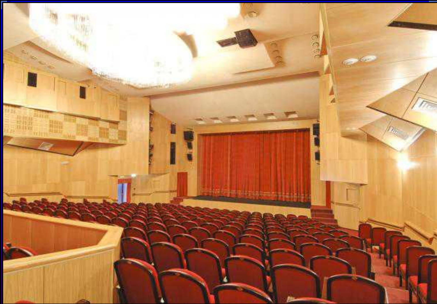
Так выглядит большой зал