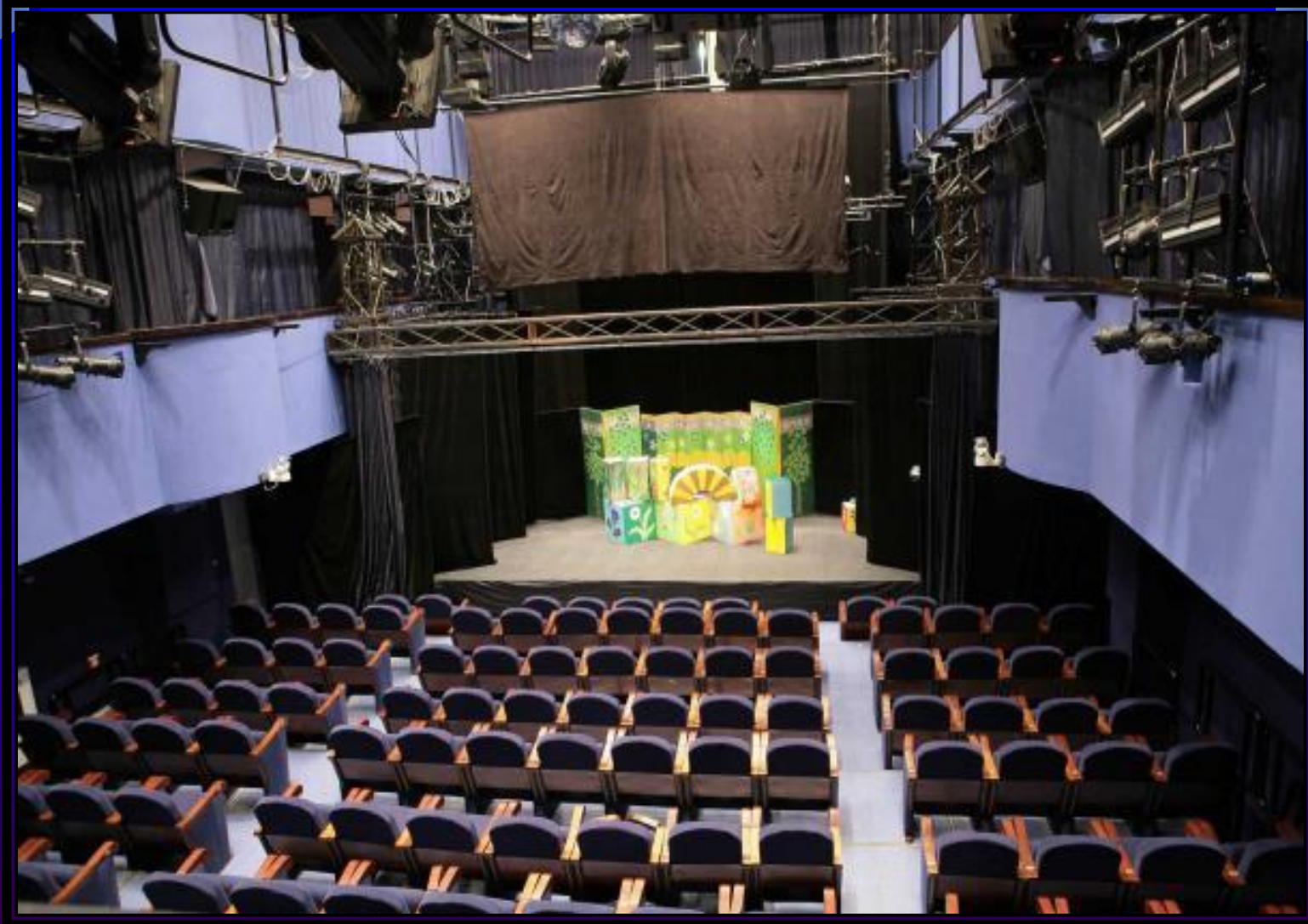
Так выглядит малый зал