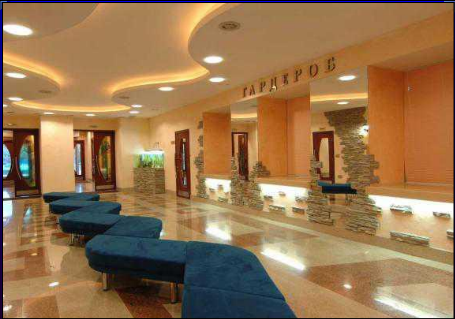
Фойе большого зала