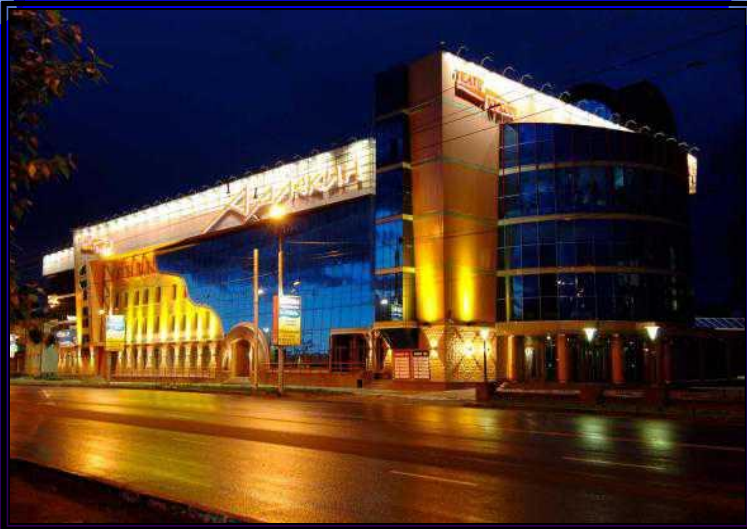
Так выглядит театр в вечерние часы