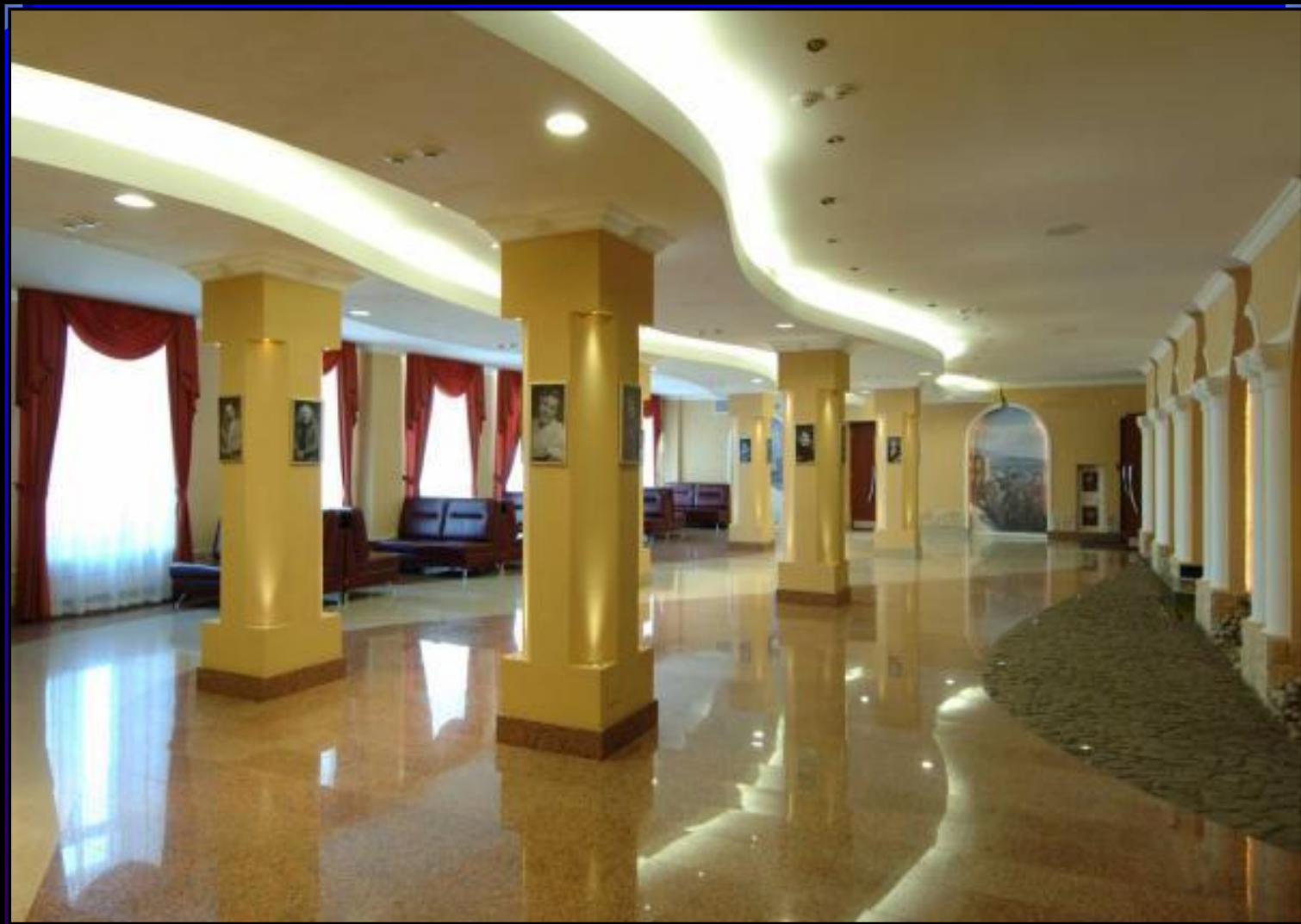
Фойе большого зала