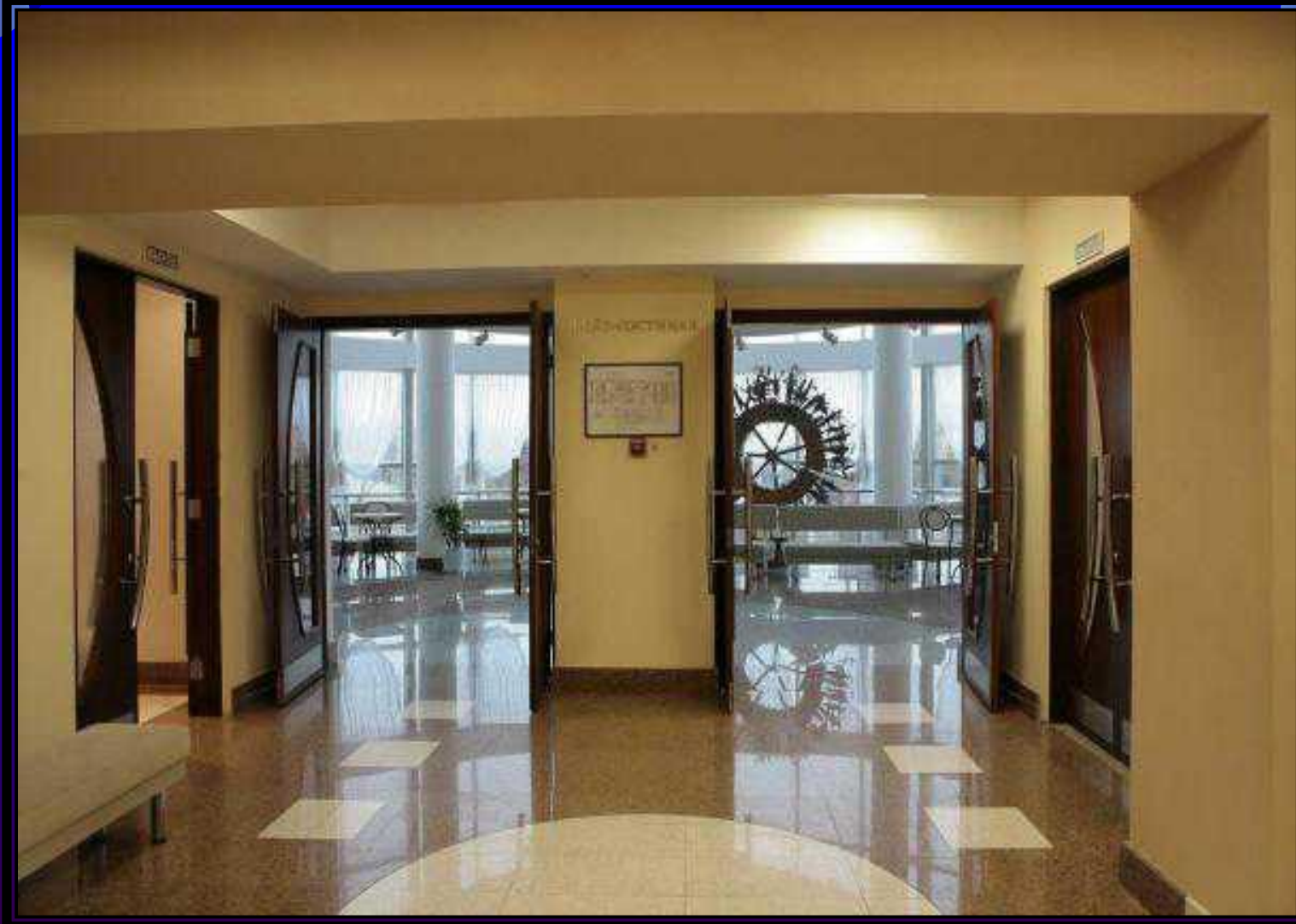
Фойе – гостиная собирает зрителей Малого зала.