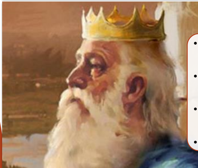
Соломон - младший сын Давида