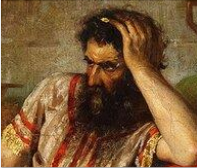
Саул - первый царь