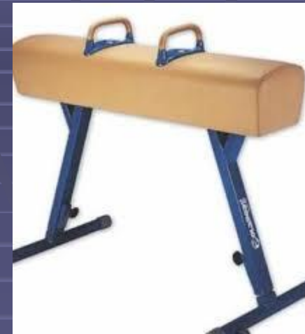
конь с ручками