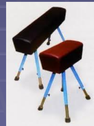
конь и козел