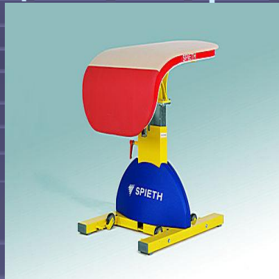
снаряд для опорного прыжка