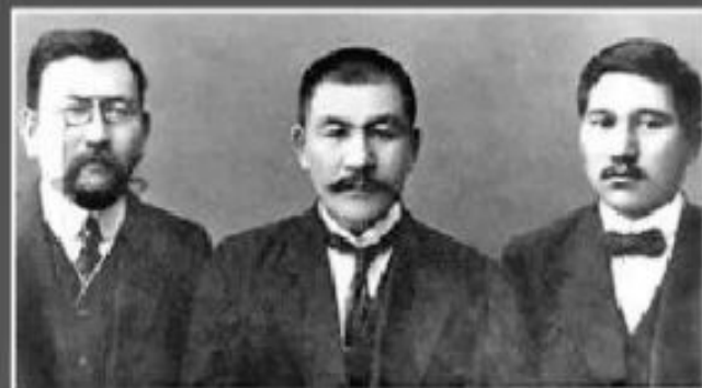
А. Байтұрсынов, А. Бөкейханов және М. Дулатов