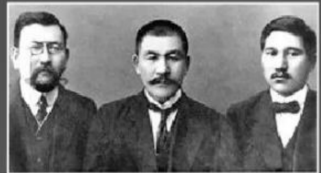
А. Байтұрсынов, А. Бөкейханов және М. Дулатов