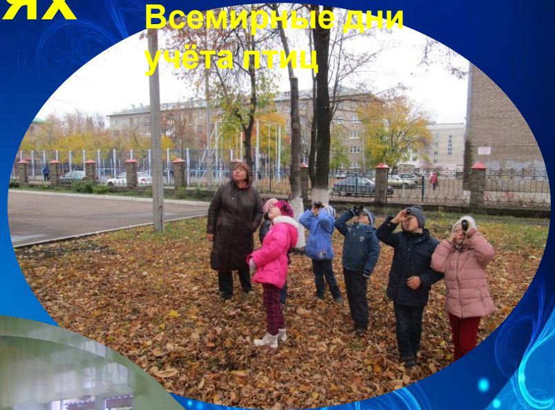
Всемирные дни учёта птиц