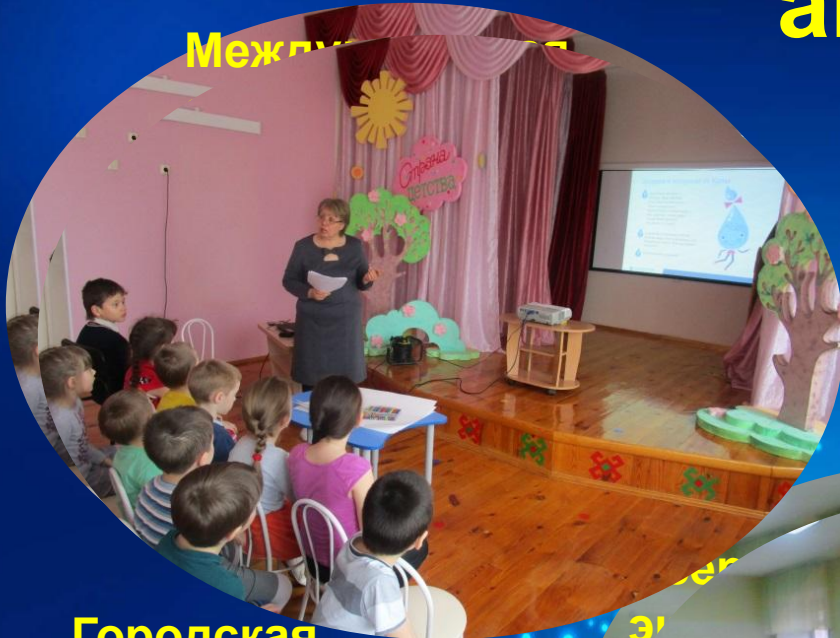
Международный конкурс «Степана Степановича»