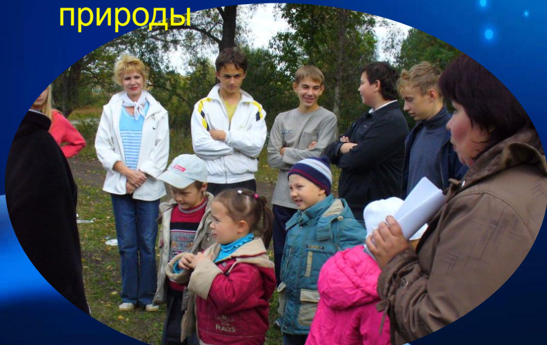
Экспедиции по памятникам природы