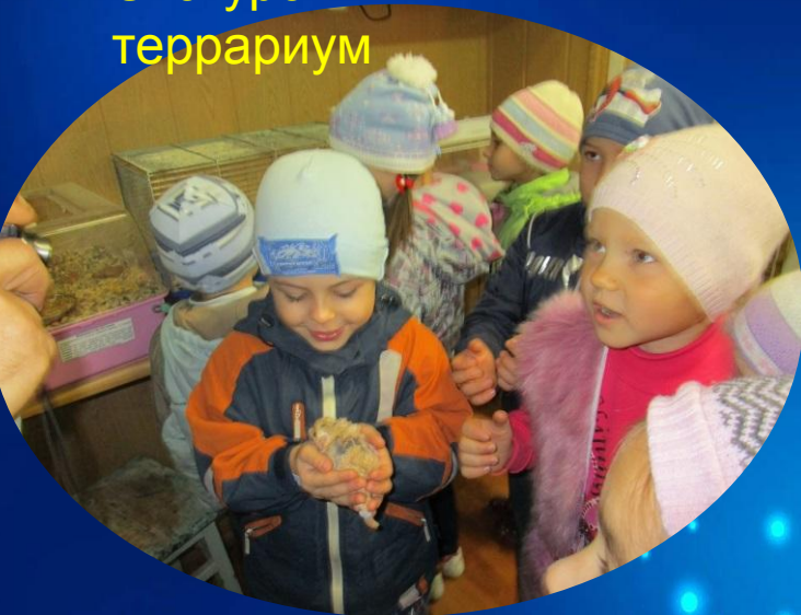
Экскурсия в террариум