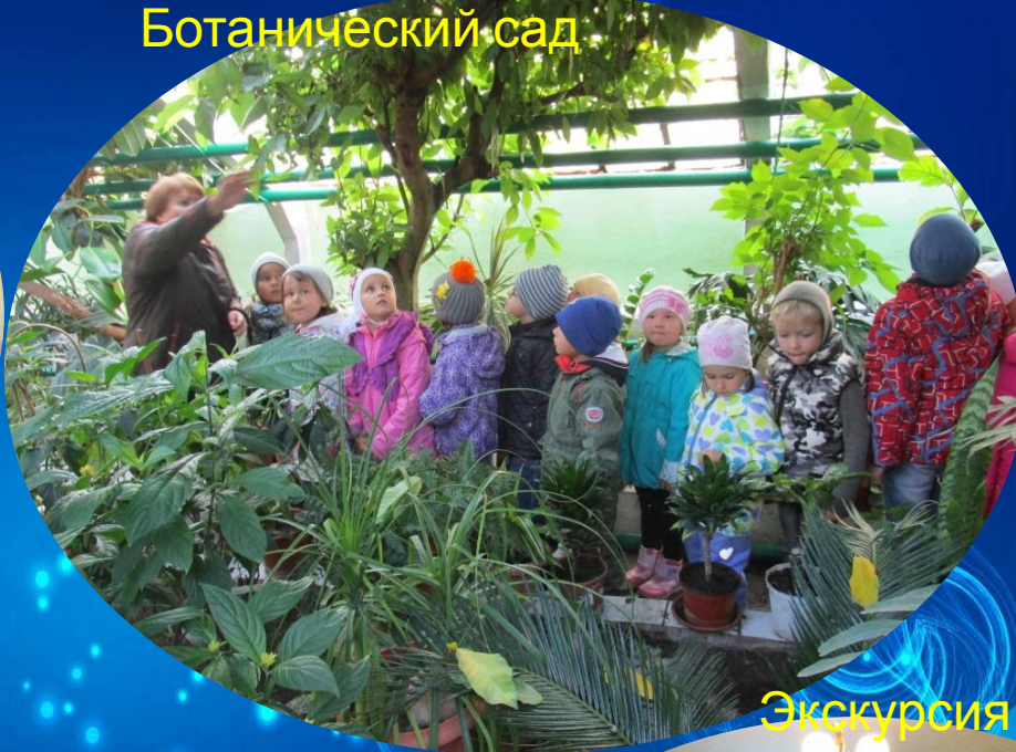
Экскурсия в оранжерею и Ботанический сад