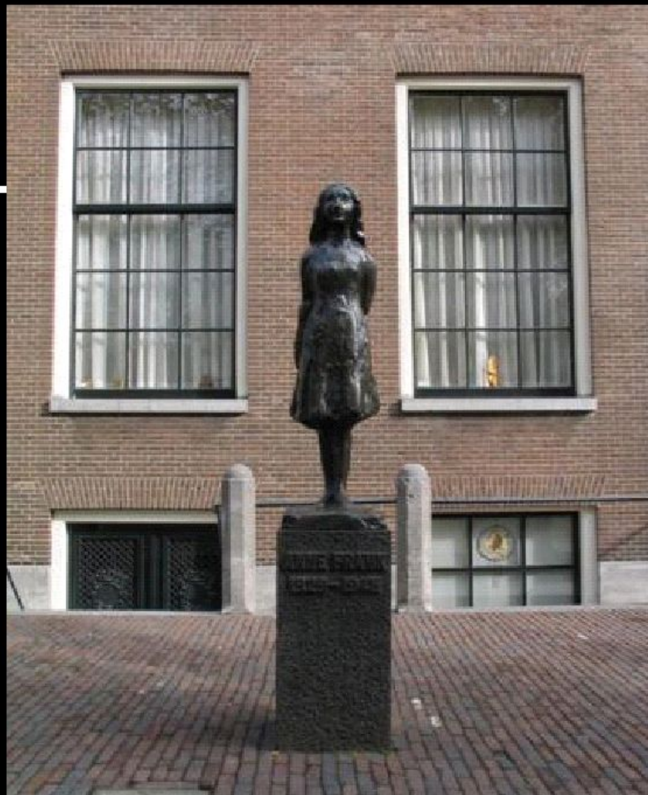
Дом- музей Анны Франк в Амстердаме