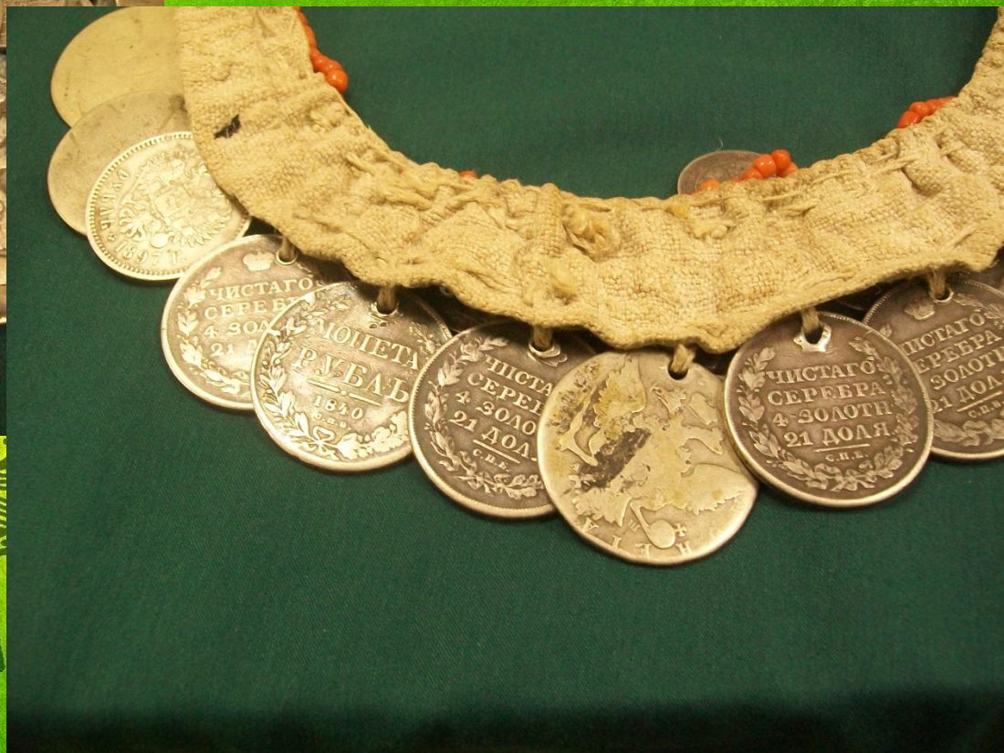
Нагрудник чувашский в нашем музее (детали)