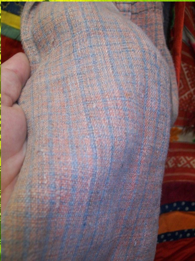
Образец самоотканого полотна на чувашской женской рубахе в нашем музее

Для изготовления одежды чуваша использовали особую ткань из нитей разных цветов (такая ткань называлась пестрядь). В платья и рубахи из такого материала стали наряжаться как на различные празднования, так и на обычные работы в поле.