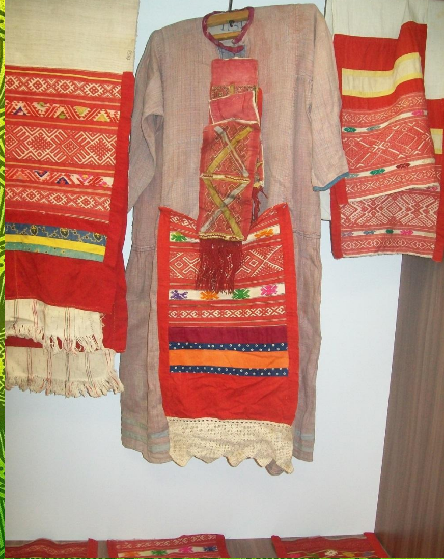
Чувашский национальный костюм в нашем музее

Рубаха (кепе) была неотъемлемым элементом как женского, так и мужского народного костюма. Конструкция рубахи была довольно простой: складывался холст, а в бока вшивали клинья, расширяющие рубаху в нижней части. Рубахи для женских костюмов изготавливались длиной 120 см и с