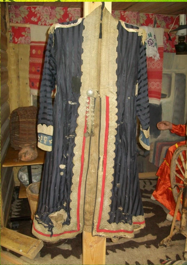
Елэн в нашем музее

Под платье надевали шаровары (ыштан), а сверху - расшитый позументом и серебряными монетами приталенный камзол. Отделявали его по-разному, в зависимости от региона. Распашные халаты бишмэты (на севере) и елэны (на юге) выполнялись из однотонного сукна и украшались монетами, позументом и