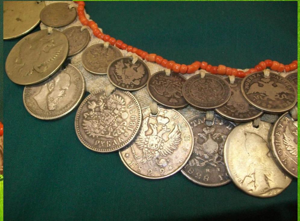
Нагрудник чувашский в нашем музее (детали)