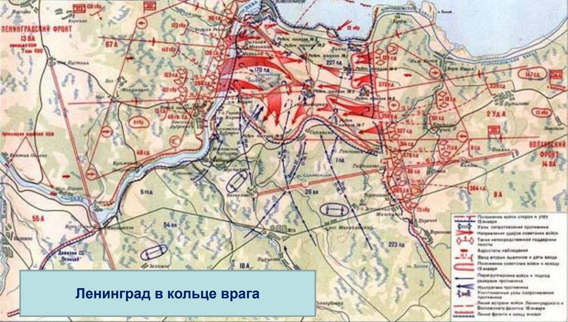
Ленинград в кольце врага