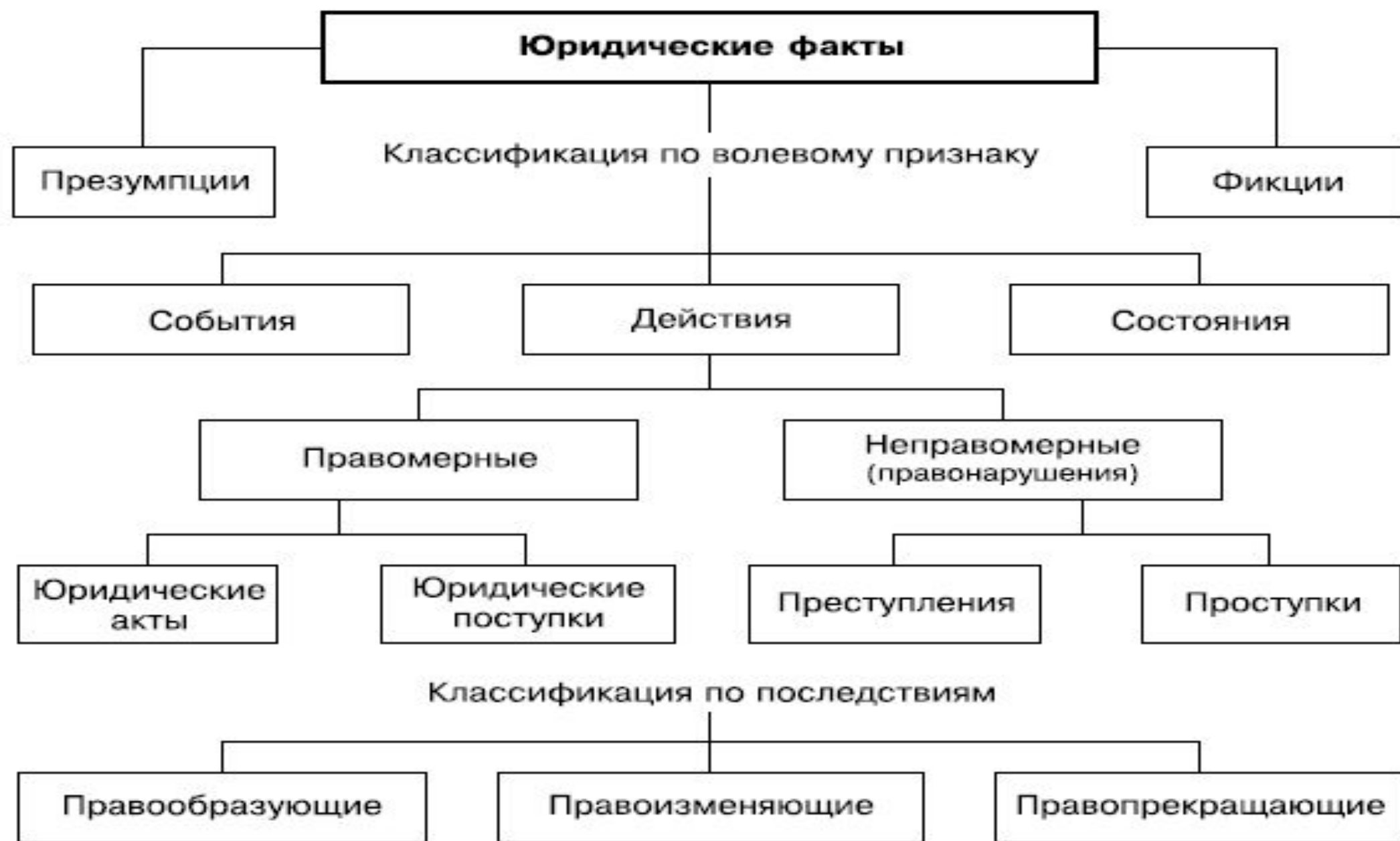
Рис. 1.2. Классификация юридических фактов