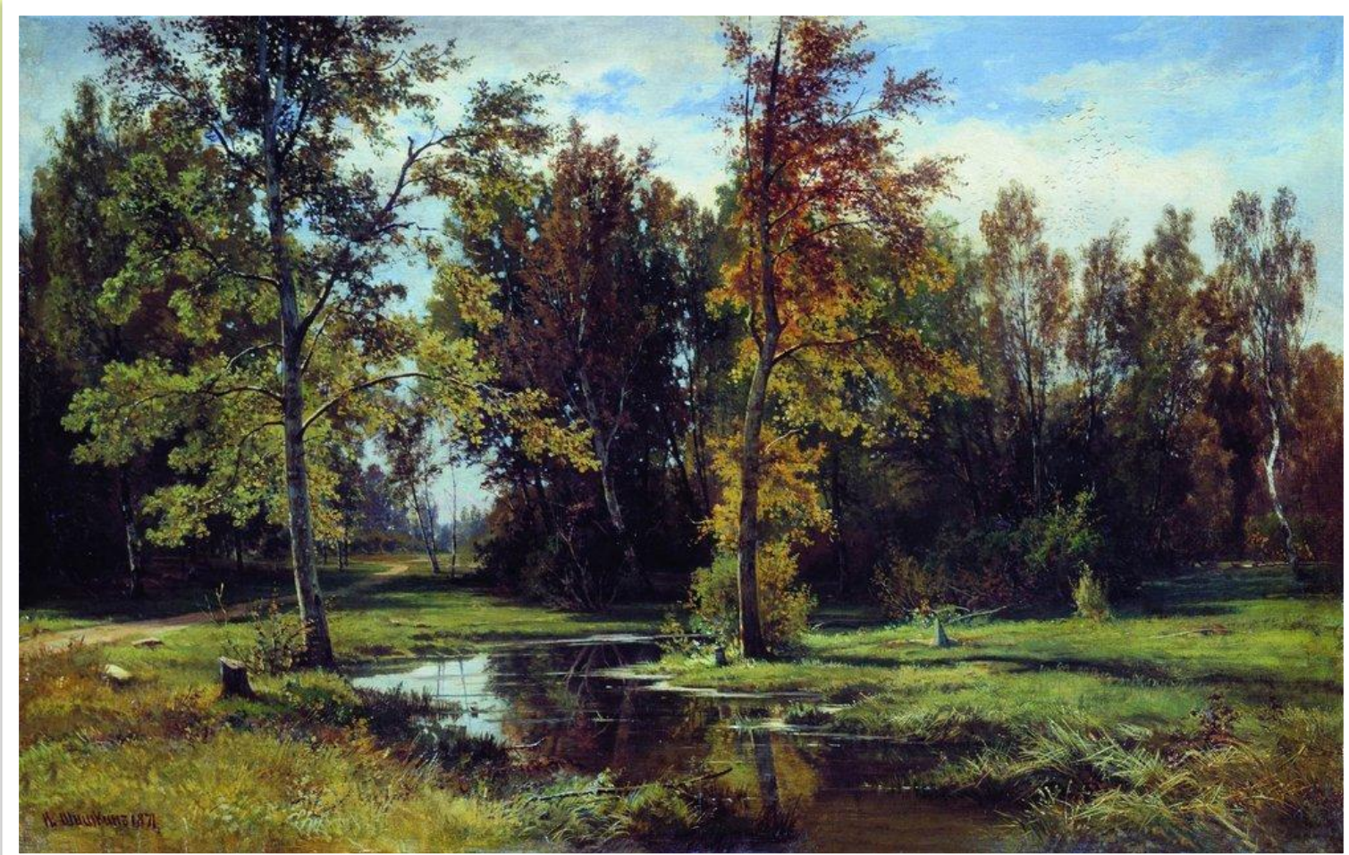
Художник И. И. Шишкин «Берёзовый

«Надеюсь, что придёт время, когда вся русская природа, живая и одухотворенная, взглянет с холстов русских художников». И.