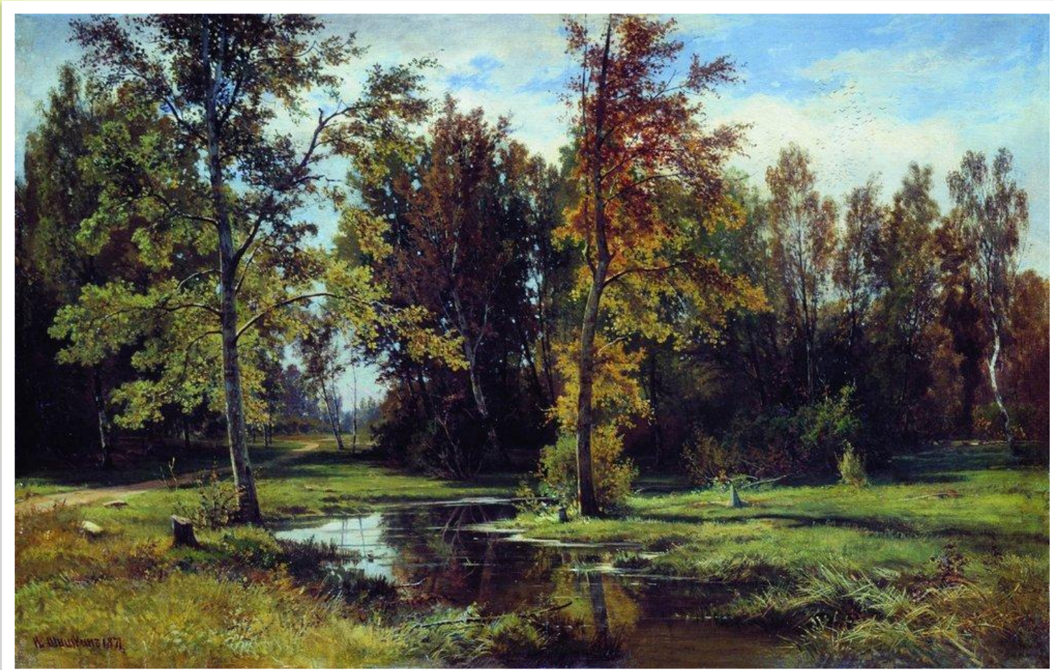
Художник И. И. Шишкин «Берёзовый»

«Надеюсь, что придёт время, когда вся русская природа, живая и одухотворенная, взглянет с холстов русских художников». И.