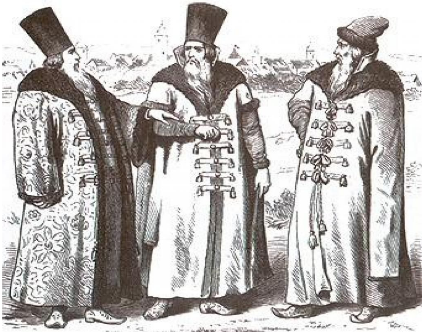
Русские бояре XVI-XVII вв.