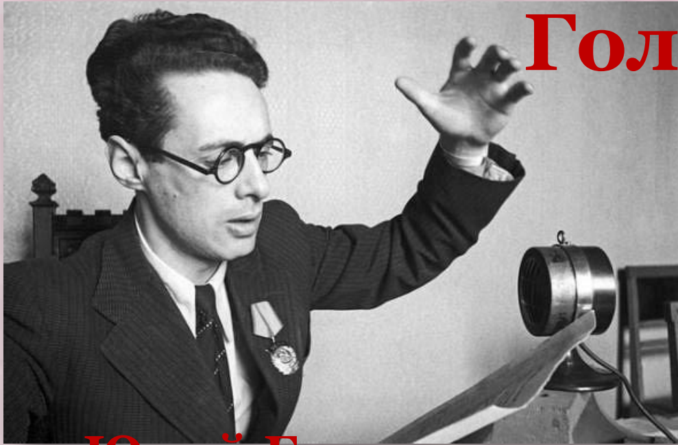
Юрий Борисович Левитан