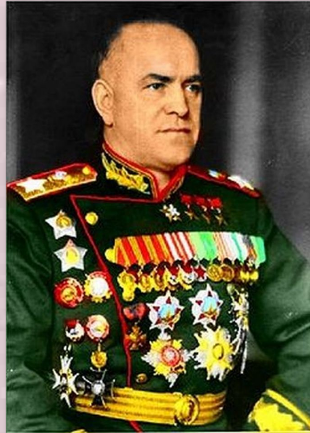
Принимал парад Маршал Советского Союза Георгий Константинович Жуков.