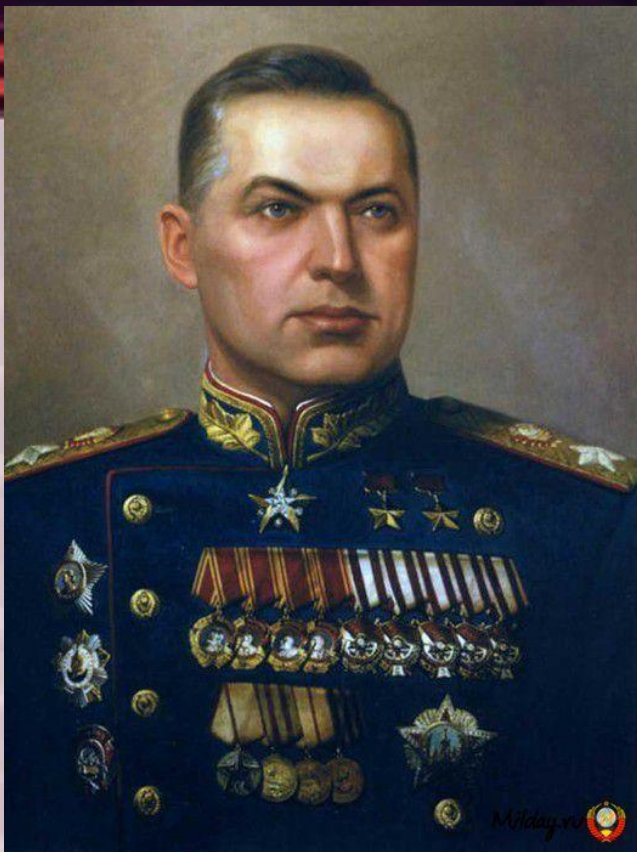
Командовал парадом Маршал Советского Союза Константин Константинович Рокоссовский