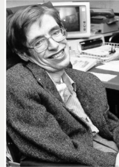
Stephen William Hawking (физик)