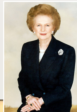
Margaret Hilda Thatcher (премьер-министр)