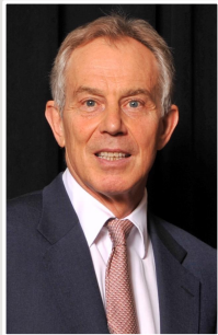
Anthony Blair (премьер-министр)