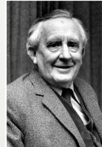
John Ronald Reuel Tolkien (писатель)