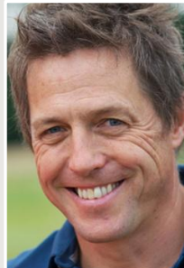
Hugh Grant (актер)