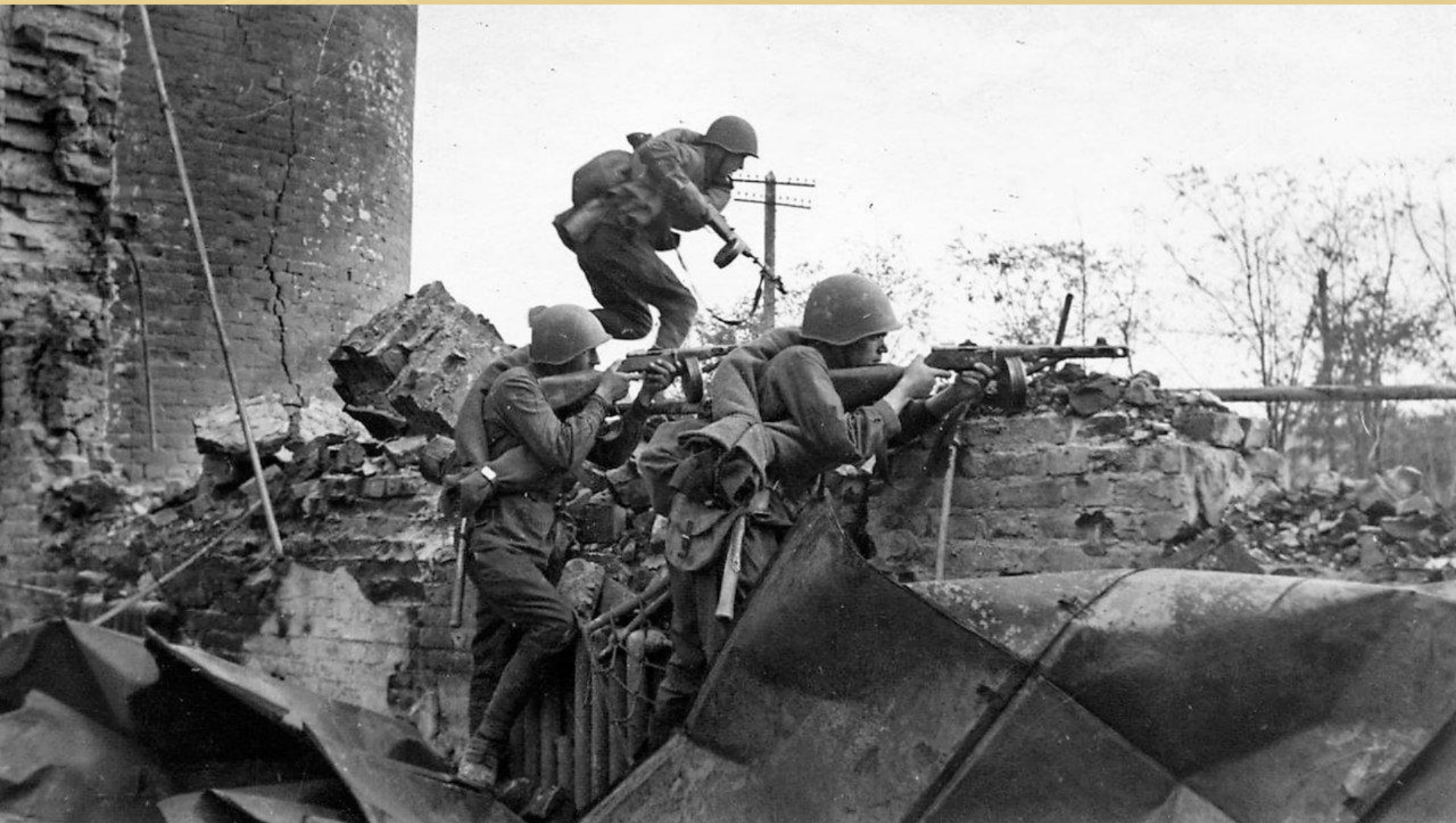
Сталинградская битва (17 июля 1942 – 2 февраля 1943)