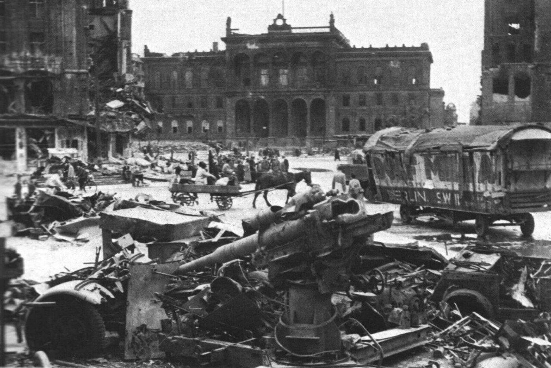
Штурм Берлина (25 апреля – 2 мая 1945)