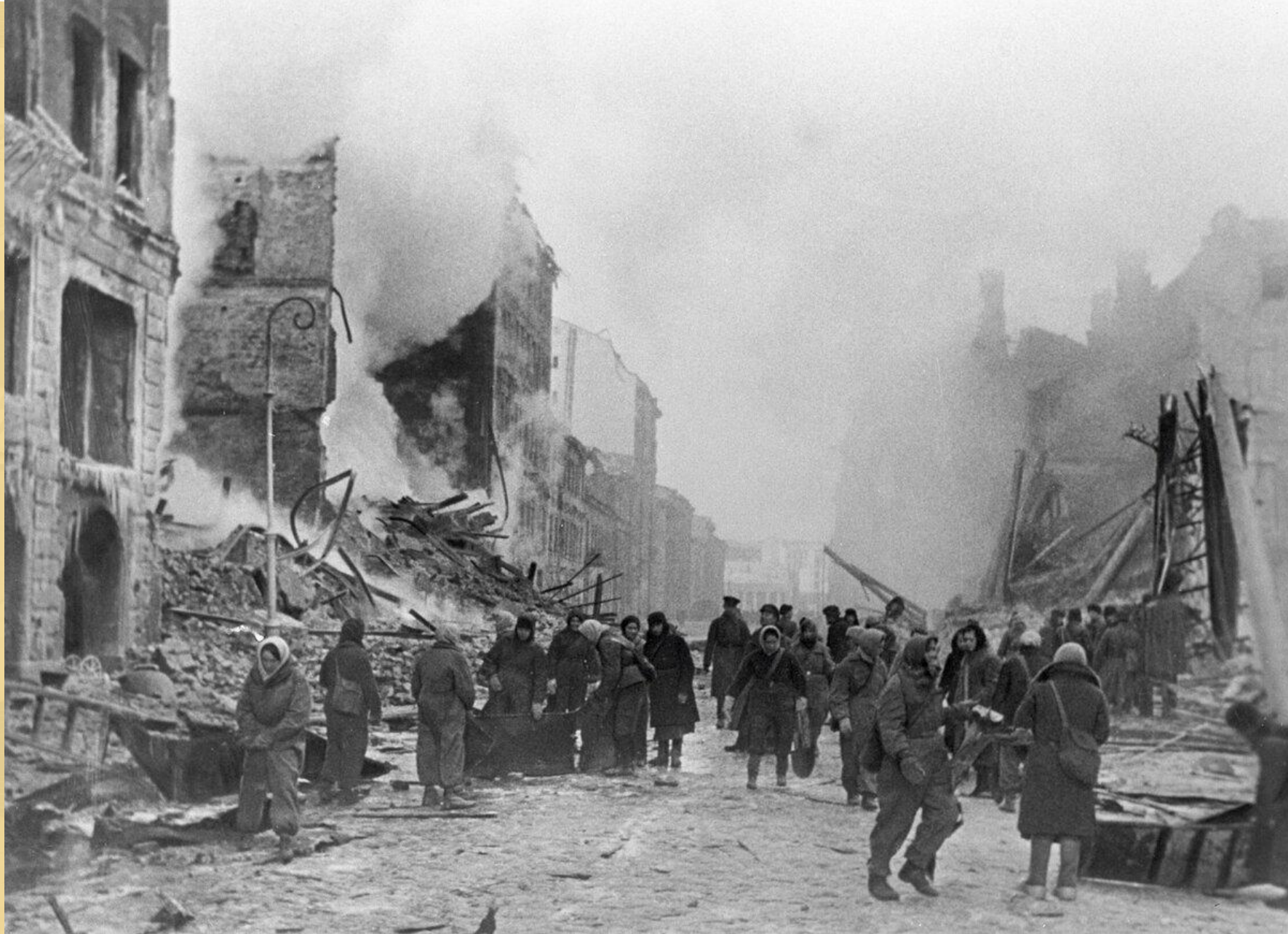
Блокада Ленинграда (8 сентября 1941 – 27 января 1944)