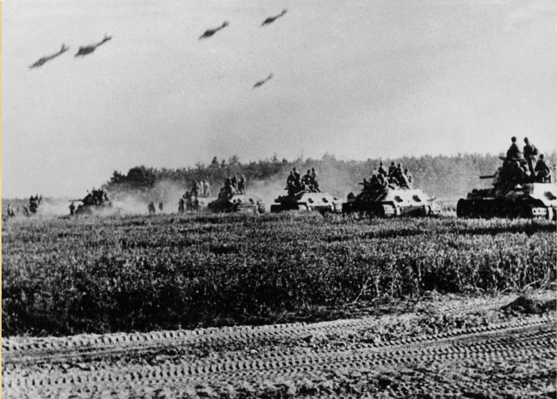
Курская дуга (5 июля 1943 – 23 августа 1943)