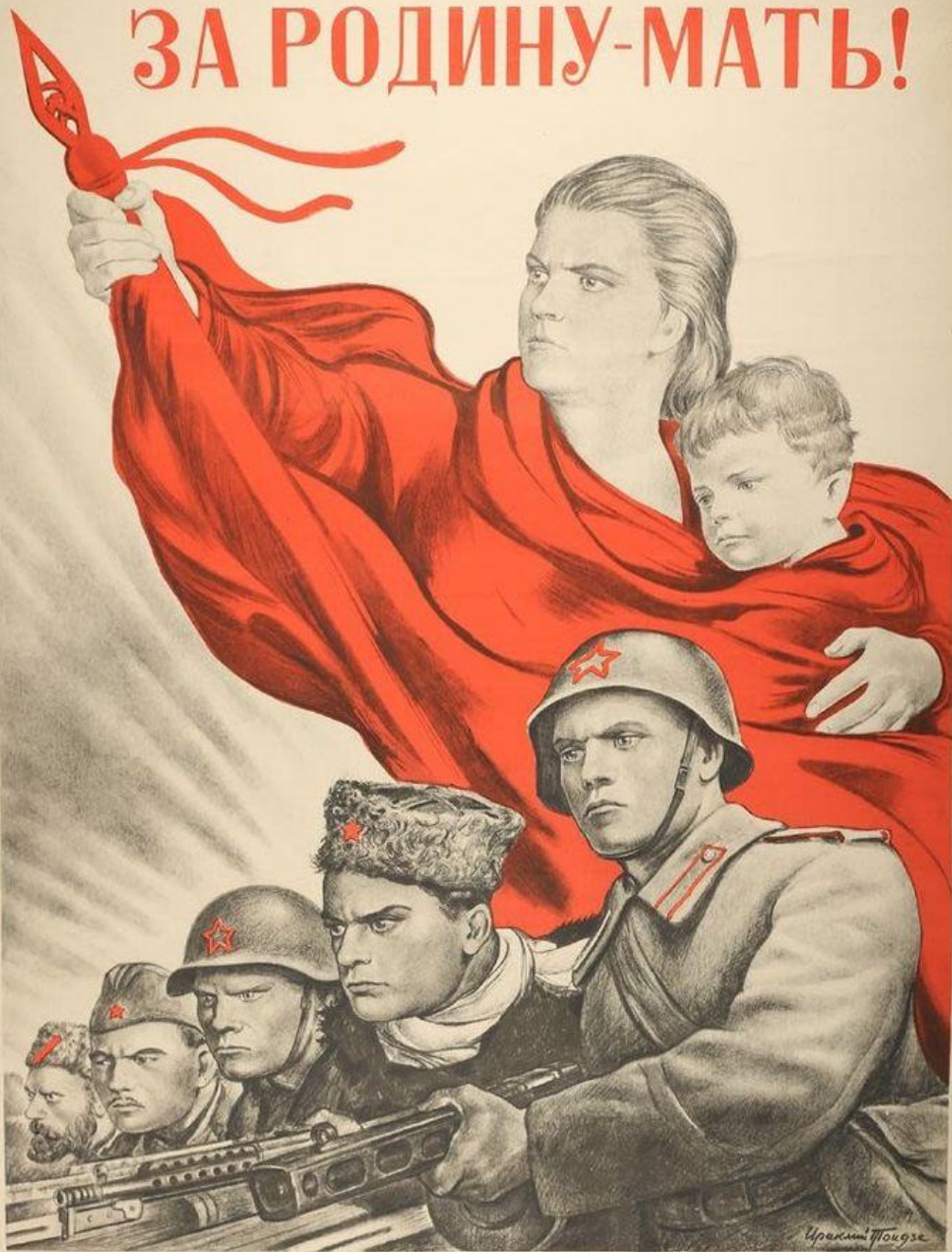
Иллюстрация: Иракли Тугузе