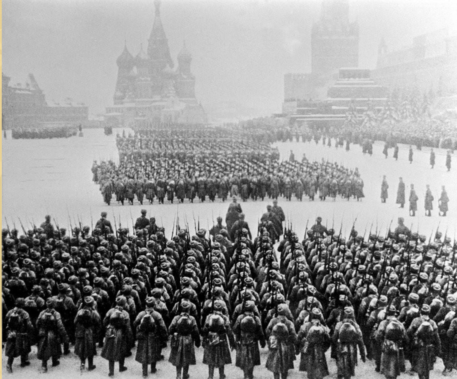
Битва за Москву (30 сентября 1941) – 20 апреля 1942