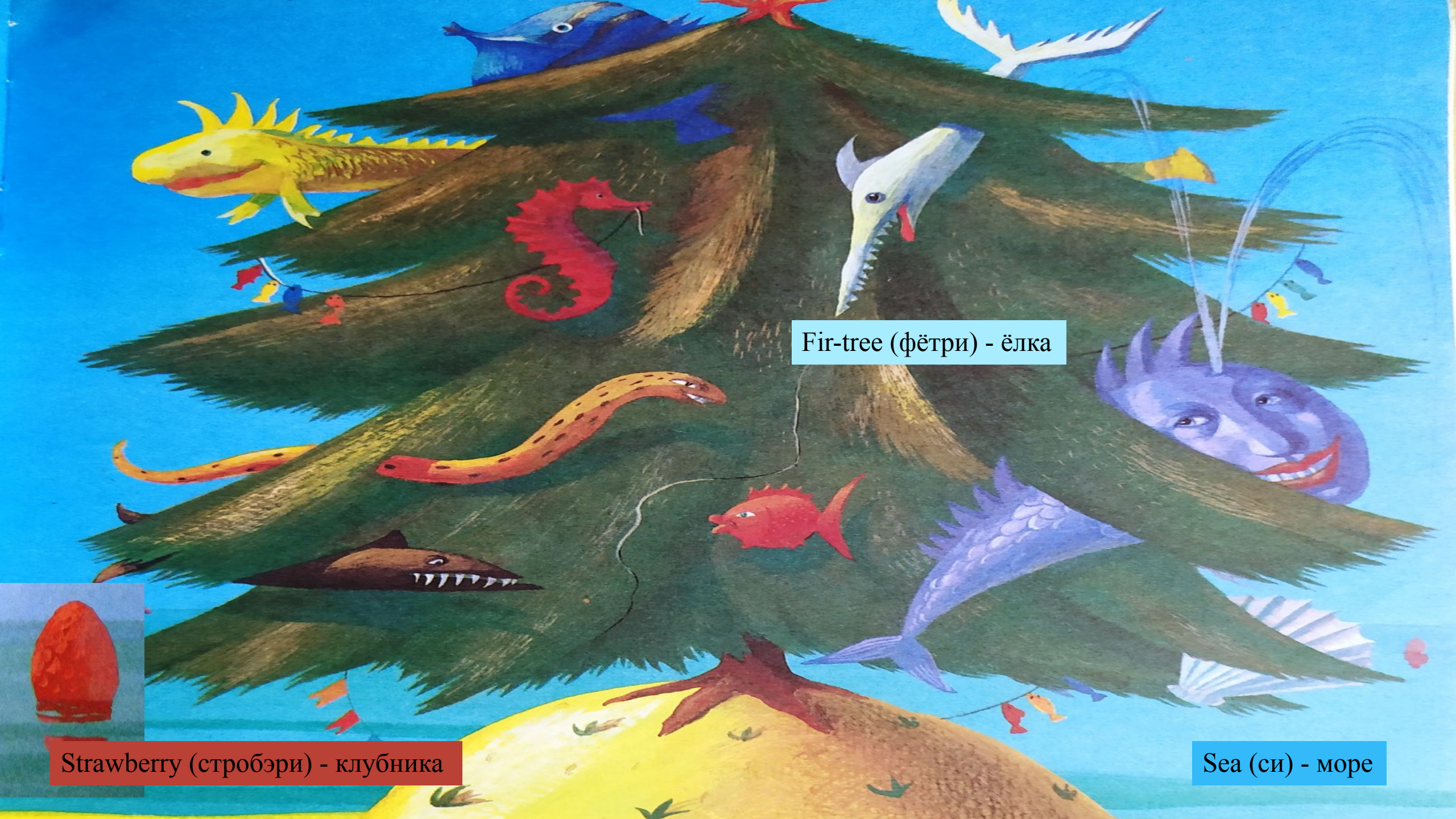
Fir-tree (фётри) - ёлка