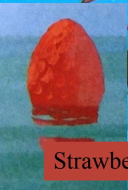
Strawberry (стробэри) - клубника