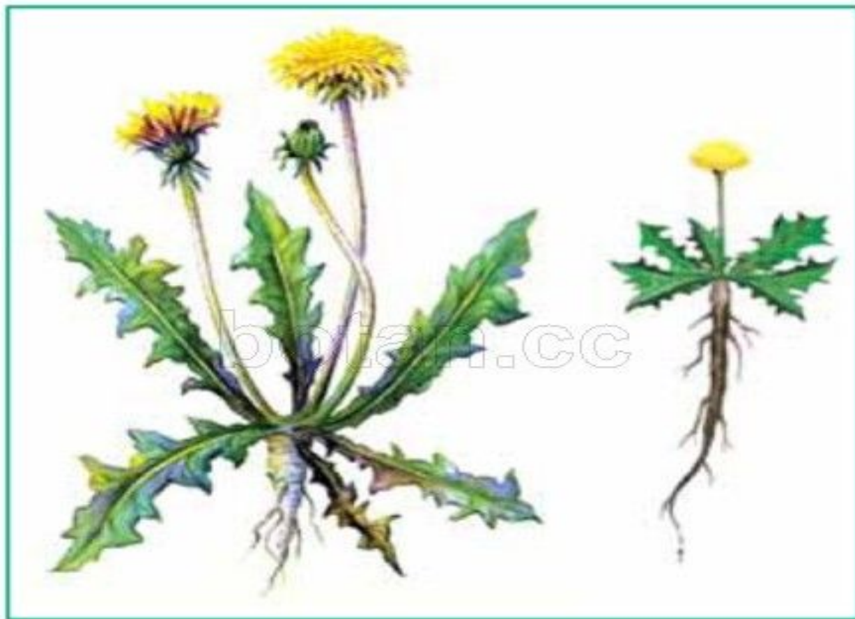
Рис. 103. Равнинная и горная формы одуванчика