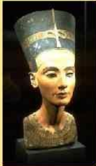
Скульптурные портреты Эхнатона и Нефертити