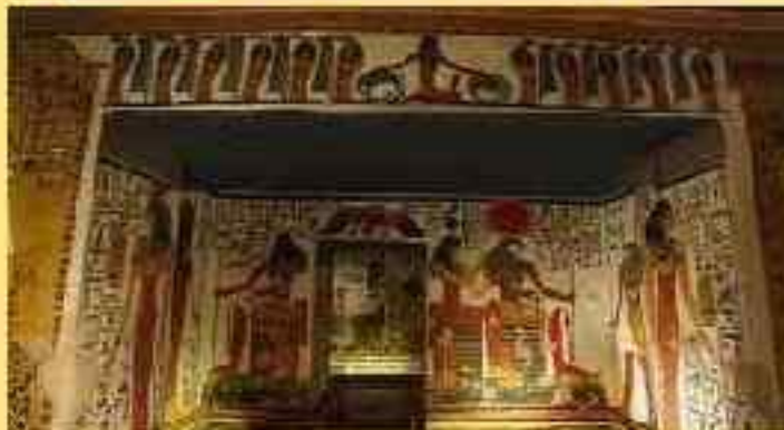
Погребальная камера гробницы Нефертити