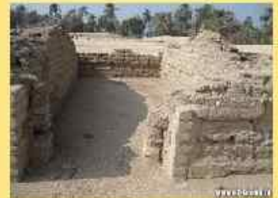
Раскопки Ахетатона, новой столицы Эхнатона