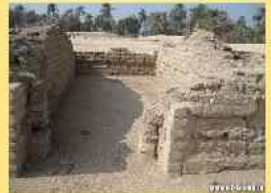
Раскопки Ахетатона, новой столицы Эхнатона