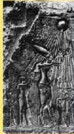
Эхнатон и Нефертити поклоняются богу Атону