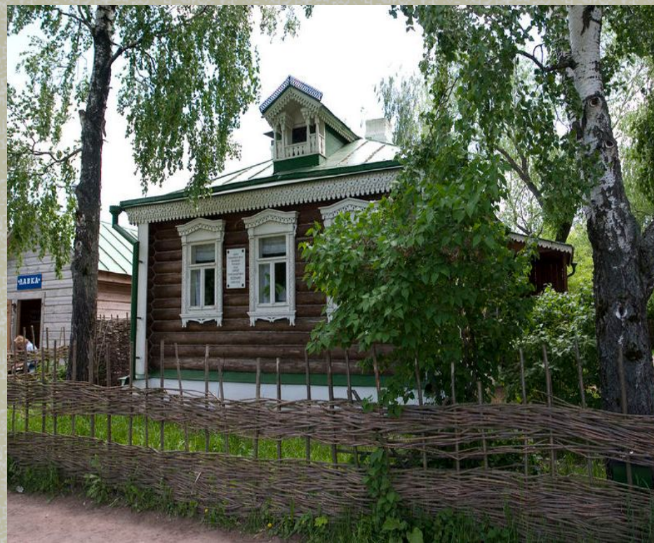
Дом Есенина в Константиново

По окончании школы, осенью 1912 года Есенин прибыл в Москву, работал в книжном магазине, а потом — в типографии И. Д. Сытина.