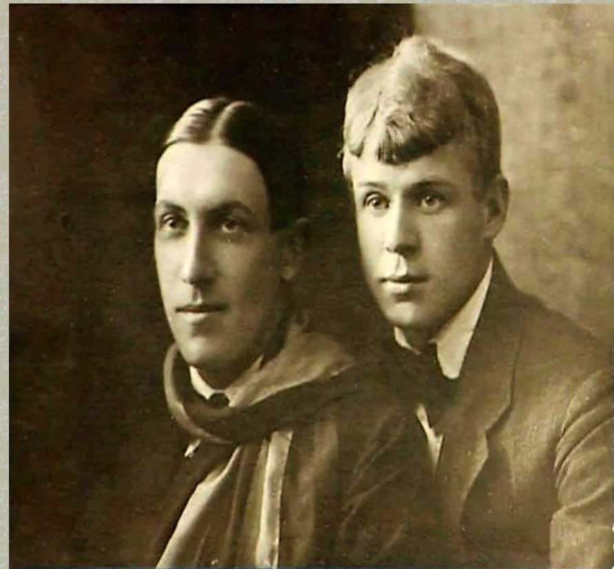
А. Мариенгоф и С. Есенин