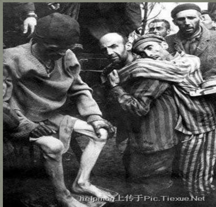
Узники концентрационного лагеря «Бухенвальд» внутри барака.