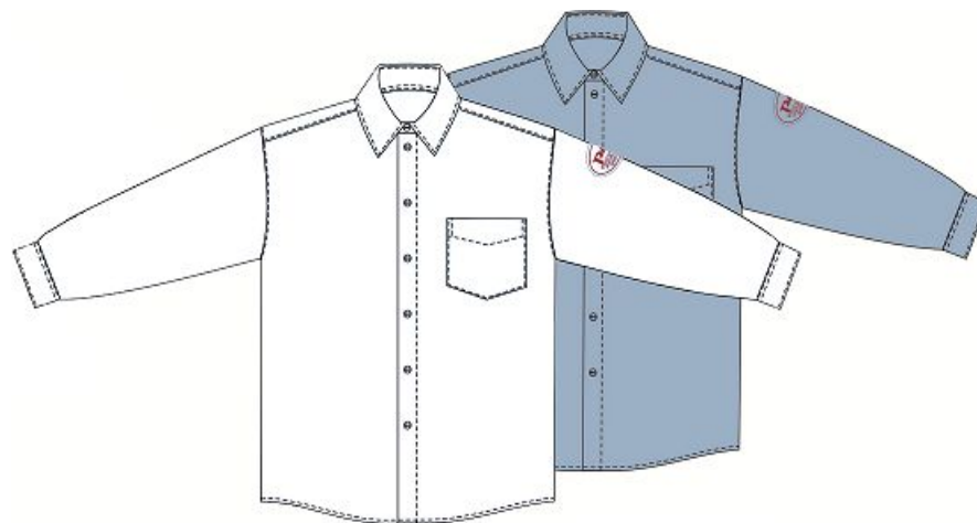
Рубашки форменные с длинным рукавом