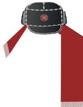
Головной убор зимний, шарф шерстяной