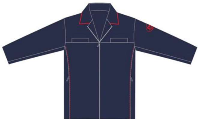
Куртка форменная на молнии