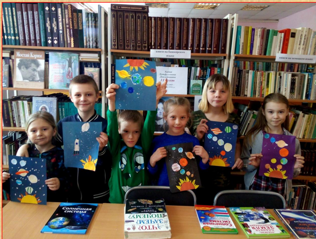
«Солнечная система» макет, аппликация