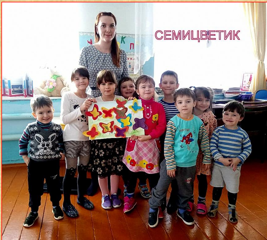
Коллективное панно ко Дню бабочки