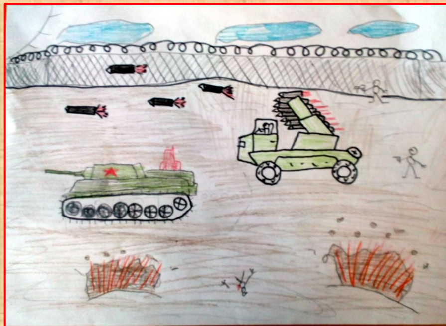
К 9 мая