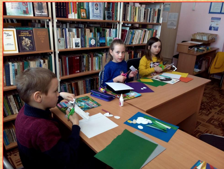
«Первые весенние цветы»