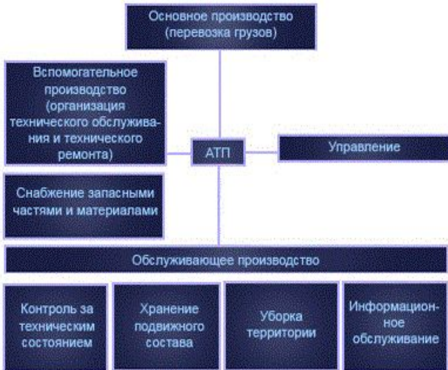
Рис. 1 Организационная структура ATP