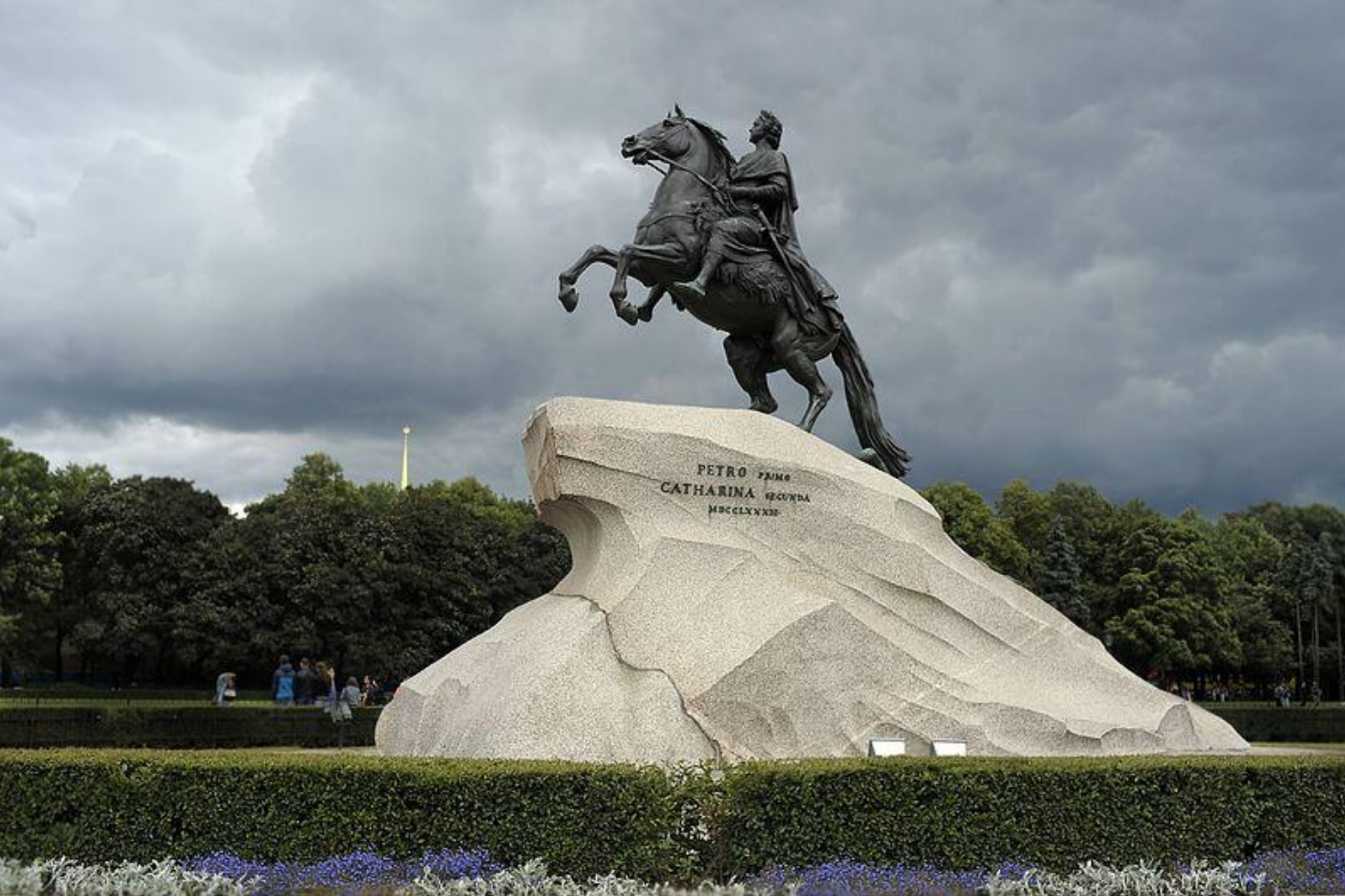
Памятник Петру I на Сенатской площади в Санкт-Петербурге