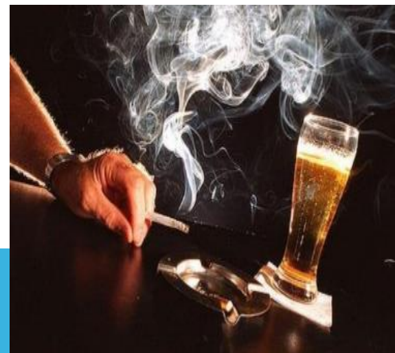
АЛКОГОЛЬ И КУРЕНИЕ