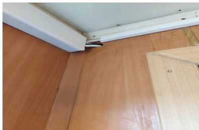
Кабель провод без кабель канала.