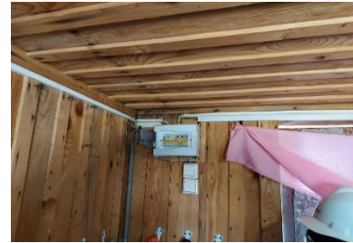
Нет однолинейной эл.схемы эл. щита.