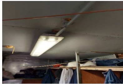
Кабельная труба висит на потолке.