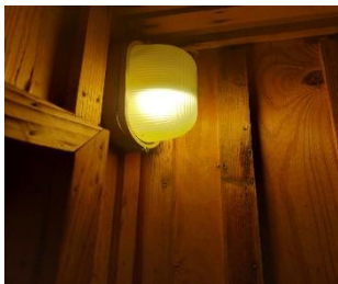
Освещения в бани должно на безопасное напряжения не более 12В.