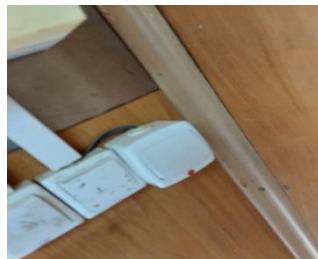
Кабель провод без кабель канала.