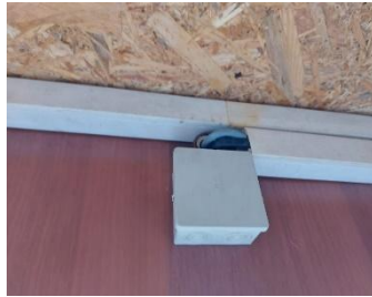
Кабеля не закрыты кабель каналам.