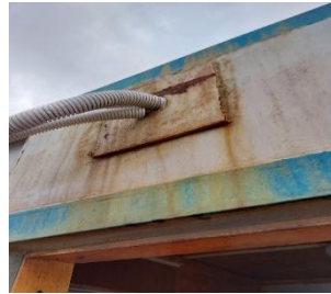
Вход кабелей должен быть через фитинг.