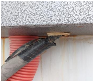
Кабель без фитинга.