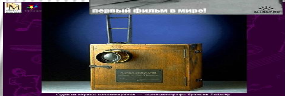
Одн из первых киноаппаратов — «синематографа» братьев Люмьер