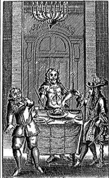
Le FESTIN de PIERRE.