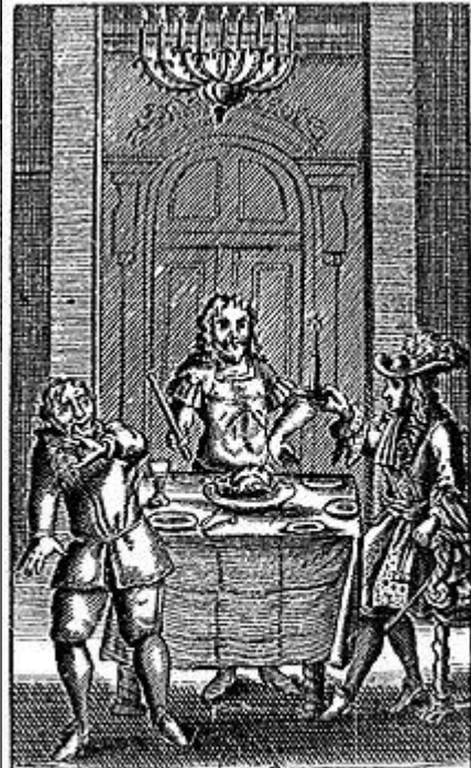
Le FESTIN de PIERRE.