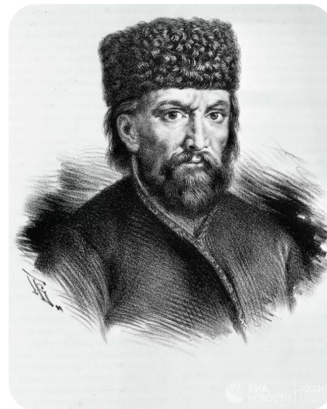
Емельян Иванович Пугачёв (1742 – 1775 гг.)