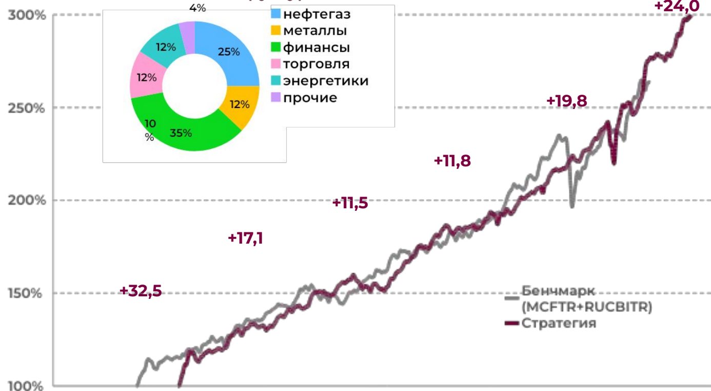
Типичная структура активов

В материале указана доходность до выплаты налогов и вознаграждения управляющего. Стратегия «Сбалансированная», результаты управления портфелем с 31.12.2014 по 28.02.2021. Результаты инвестирования в прошлом не определяют и не являются гарантией доходности инвестирования в будущем. Все расчеты приведены в порядке информации и имеют целью наглядным образом показать работу инвестиционной стратегии.