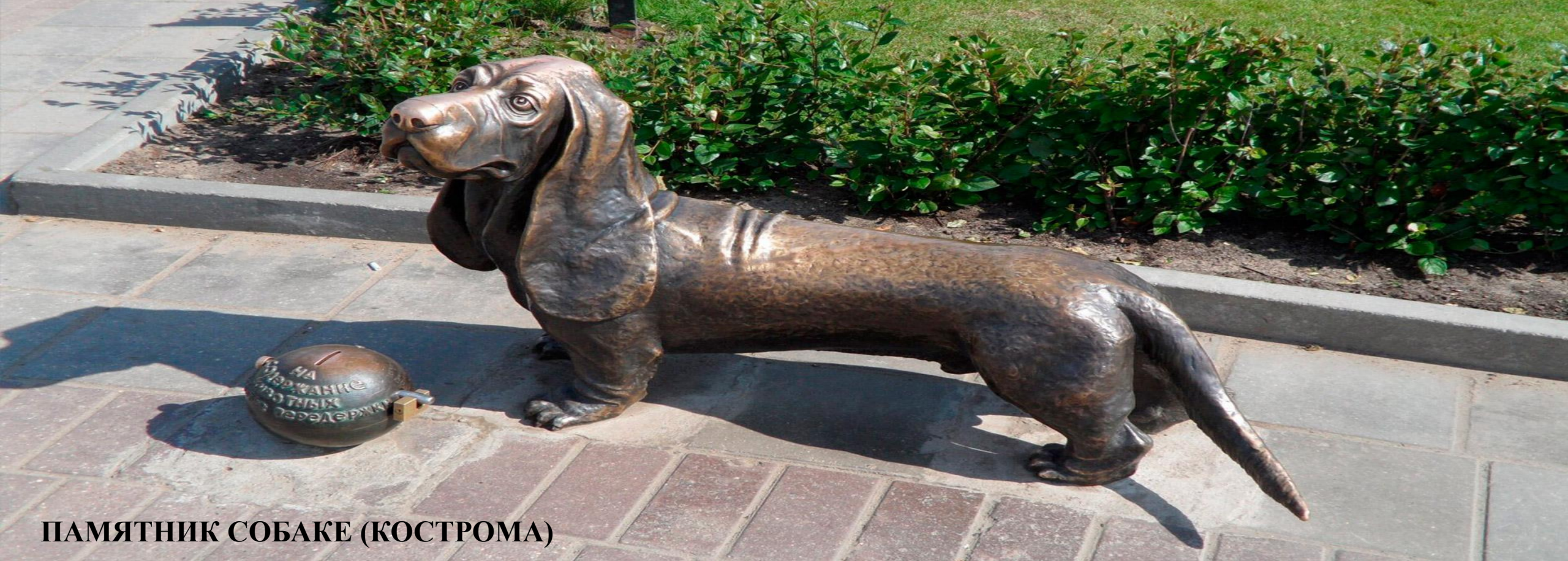
ПАМЯТНИК СОБАКЕ (КОСТРОМА)